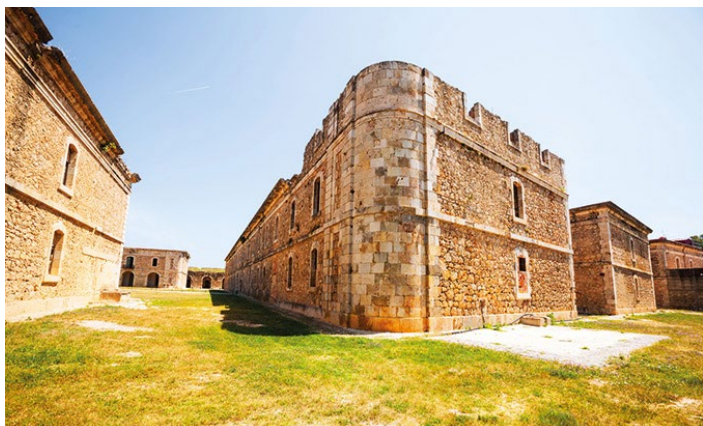
▲ Castell de Sant Ferrán

Przy samej Ramblí pod nr. 2 mieści się Museu de L'Empordà ( www.museuem-porda.org ) z kolekcją archeologiczną epoki starożytnej, rzeźbą średniowieczną oraz malarstwem i rzeźbą XIX i XX w. Zobaczymy tu dzieła takich artystów jak: Ramon Casas, Joaquín Sorolla, Joaquín Mir, Antoni Tàpies czy Salvador Dalí.