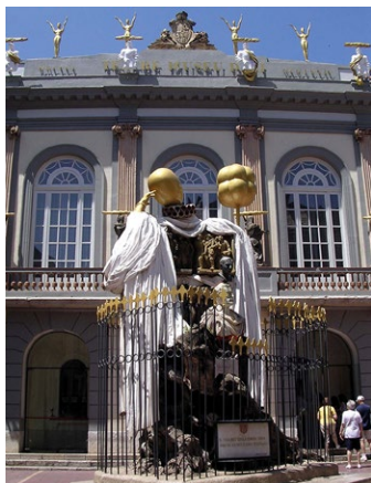
▲ Wejście do Teatre-Museu Dalí z pomnikiem Francesca Pujols, katalońskiego pisarza i filozofa

Wnętrze Teatru-Muzeum kryje bogaty dorobek artystyczny Dalego, od pierwszych doświadczeń i eksperymentów z impresjonizmem, futuryzmem, kubizmem, po dojrzałe prace surrealistyczne i wreszcie dzieła wykonane u schyłku życia. Całość jest wykreowana, wymyślona i zaprojektowana przez artystę z klimatem i estetyką typową dla jego ekscentrycznej sztuki i niesamowitej wyobraźni.