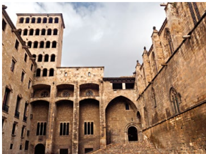
▲ Palau Reial Major

Prawdziwą gratką dla pasjonatów historii będzie Plaça del Rei , czyli Plac Króla. Zespół zabytkowy Conjunt Monumental de la Plaça del Rei tworzy kompleks budowli dawnego Pałacu Królewskiego, który od XIII do początków XV w. był siedzibą hrabiów Barcelony i królów Aragonii, oraz fragmenty rzymskiego miasta. Znajdziemy tu imponujące Muzeum Historii Barcelony Museu d'Història de Barcelona MUHBA, Plaça del Rei bez nr; www.museu-historia.bcn.cat ; czynne wt.–sb. 10.00–19.00, nd. 10.00–20.00, święta 10.00–14.00; wstęp 7 EUR, bilet ulgowy 5 EUR. Temple d'August , c. Paradis 10 ; czynne pn. 10.00–14.00, wt.–sb. 10.00–19.00, nd. 10.00–20.00; wstęp gratis. Wizyta obejmuje zwiedzenie ruin rzymskich odkrytych w podziemiach pod Plaça del Rei i Plaça de l'Àngel oraz najważniejszych części Pałacu Królewskiego. Archeologiczne wykopaliska o powierzchni 4000 m 2