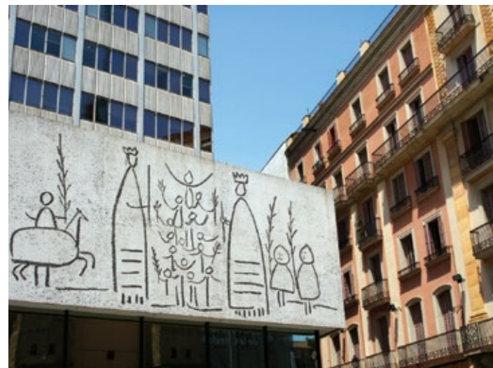
▲ Fryz projektu Pablo Picasso w Col·legi d'Arquitectes

Swoistym centrum politycznym Barcelony jest dostojny plac św. Jakuba (Plaça de Sant Jaume) z powiewającymi dumnie flagami Katalonii, Hiszpanii i Barcelony. W czasach antycznych w tym miejscu było forum