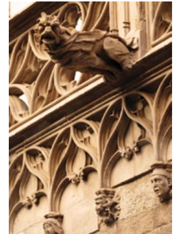
▲ Gotyckie gargulce katedry

– a oficjalnie La Catedral de la Santa Creu i Santa Eulàlia. Katedra wznoszona była od końca XIII do połowy XV w. Monumentalna budowla mierzy 90 m długości i 40 m szerokości, składa się z kościoła i kruchtów klasztornych (Claustre) doskonale ze sobą splecionych architektonicznie. Początki