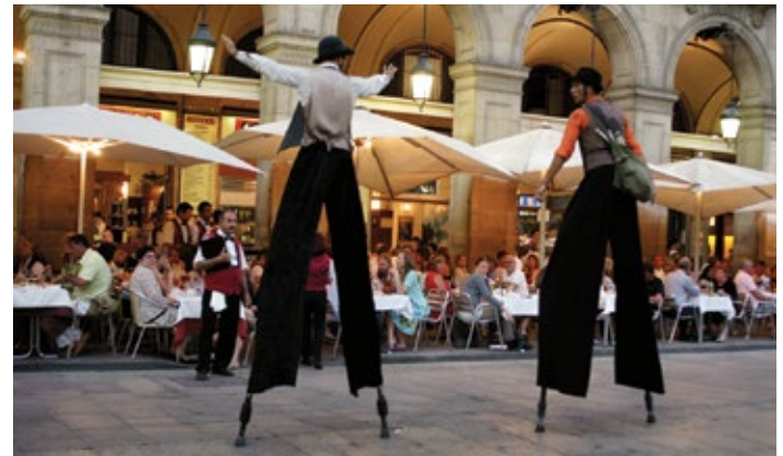
▲ W Barri Gòtic o turystach nikt nie zapomina

Spacerując uliczkami dzielnicy gotyckiej, napotkamy mnóstwo innych zabytkowych zaułków, placów i kościołów. XIV-wieczny kościół gotycki – Església de Santa Maria de Pino 📍 c. Cardenal Casañas 16 / Plaza de Sant Josep Oriol 78 , wyróżnia ogromna dekoracyjna rozeta o średnicy 10 m, jeden z typowych elementów katalońskiego gotyku. Świątynia poświęcona jest Matce Boskiej, a przymiotnik de pino nawiązuje do drzewa