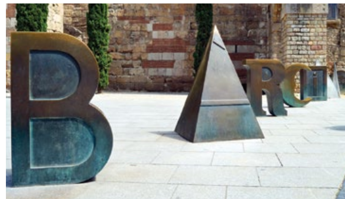
▲ Barcino Joana Brossy

W pobliżu katedry warto zaglądnąć na Placą Nova de Barcelona , przy którym zachowały się fragmenty dawnej antycznej