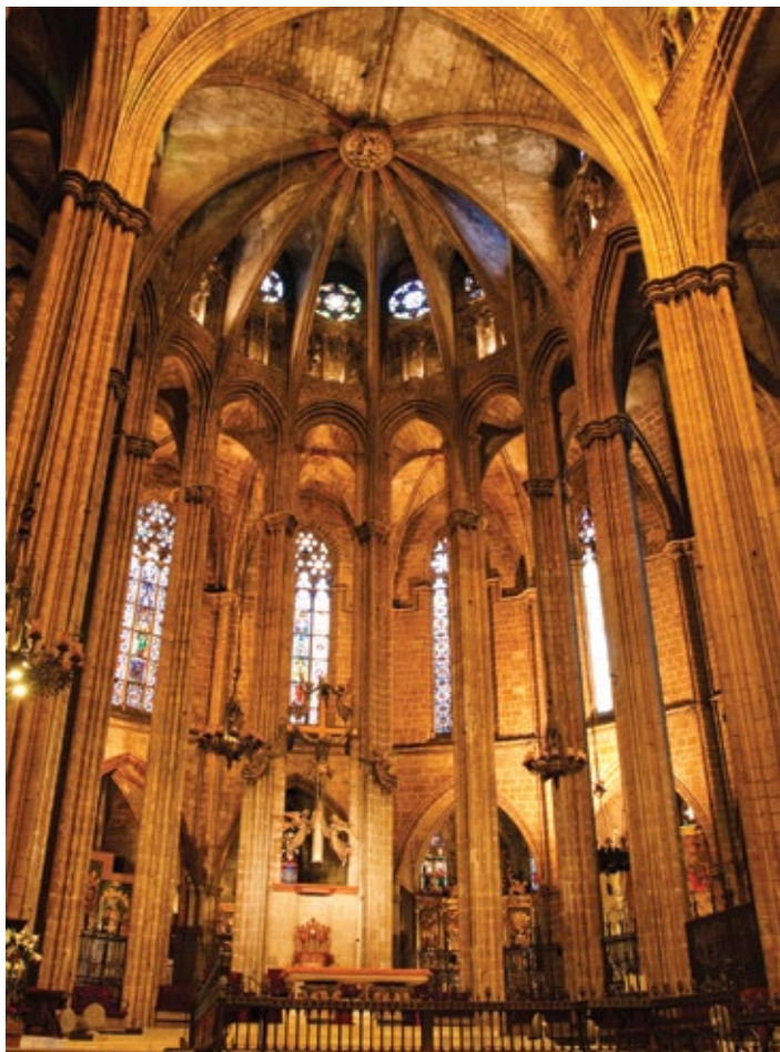
▲ Gotyckie wnętrze katedry w Barcelonie

powstania katedry sięgają czasów króla Katalonii Jakuba II i roku 1298, chociaż najstarszą jej częścią jest wchłonięta przez katedrę wcześniejsza romańska kaplica Capella de Santa Llúcia (poświęcona już w 1058 r.).