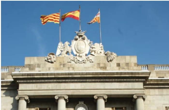
▲ Główna fasada Ratusza Miejskiego – Casa de la Ciutat

rzymskie – czyli najważniejszy plac miasta i ośrodek życia publicznego i politycznego. Jedno skrzydło placu zajmuje budynek Ratusza Miejskiego 📍 Casa de la Ciutat , Plaza de Sant Jaume 1 ; czynny do zwiedzania w nd. 10.00–13.30 lub z przewodnikiem po umówieniu się, inaczej Ajuntament de Barcelona. Reprezentuje różne style architektoniczne, a początki jego powstania sięgają 1369 r. Neoklasyczną fasadę główną z 1847 r. zaprojektował kataloński architekt Josep Mas i Vila. Dwie rzeźby dłuta Josepa Bovera przedstawiają króla Jakuba I (który założył Radę Stu, pierwszą formę rady miejskiej sprawującą rządy do 1714 r.) oraz członka Rady Stu i wybitnego barcelończyka – Joana Fivellera. Od strony Carrer de la Ciutat można zobaczyć oryginalną fasadę gotycką z 1399 r. (nad jej główną bramą widać pośrodku herb króla Aragonii Piotra III, a po bokach herby Barcelony). Największą perłą wnętrza ratusza jest gotycka Saló de Cent , czyli sala Rady Stu z XIV w., zaprojektowana przez średnio-wiecznego architekta katalońskiego Pere Llobeta (twórca także fasady gotyckiej). Piękna jest Saló de Cròniques , czyli Sala Kronik,