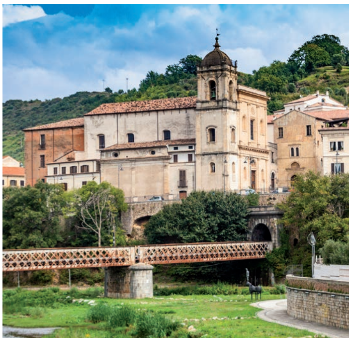
▲ Klasztor św. Franciszka z Paoli

nego Castello Normanno-Svevo (zamek normańsko-szwabski). Jego historia sięga początków XII w. i króla Rogera II, choć być może powiększył on tylko starszą twierdzę, jaka już wcześniej stała w tym miejscu. Zamek został zniszczony podczas katastrofalnego w skutkach trzęsienia ziemi w 1184 r., po czym odbudował go Fryderyk II, stąd obiekt bywa nazywany „zamkiem szwabskim”. Twierdza stała się później rezydencją Ludwika III Andegaweńskiego, króla Neapolu, a następnie przywrócono jej funkcję wojskową, czyniąc z niej jeden z najważniejszych punktów obronnych w Kalabrii. Historia zamku właściwie zakończyła się w XVII w., kiedy popadł w ruinę po kolejnym trzęsieniu ziemi. Dziś jest po prostu atrakcją turystyczną 📍 wt.–sb. 9.30–18.00, nd. 10.00–18.00; 4 EUR normalny, 2 EUR ulgowy.