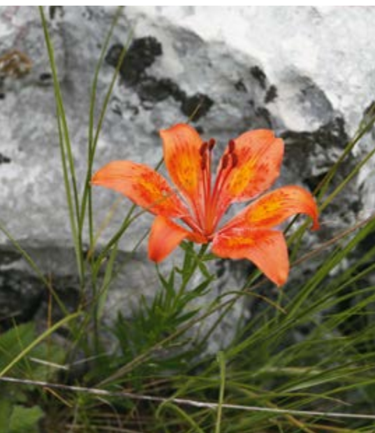
▲ Lilia świętego Jana.

co pozwalało na eksport do całej Europy, nawet do tak odległego Petersburga. Wiele czynników, jak masowa oferta owoców cytrusowych po niskiej cenie pochodzących z południa Włoch, która pojawiła się po zjednoczeniu kraju, czy odkrycie syntetycznego kwasu cytrynowego spowodowały głęboki kryzys plantacji cytrusowych nad jeziorem Garda, w szczególności tych z rejonu Limone. Tu kryzys postępował począwszy od II połowy XIX wieku aż do połowy XX wieku, mimo że izolacja miejscowości skończyła się w październiku 1931 r. wraz z otwarciem drogi (Gardesana Occidentale). Obie wojny światowe zadały uprawom ostateczny i śmiertelny cios. Dziś, dzięki projektom rewitalizacji, zostały odrestaurowane i w dużej części udostępnione dla zwiedzających limonaie : Tesòl, Villa Boghi, Castél, Garbéra, Sopino, Nuà i Reamòl w Limone oraz limonaia Prà de la Fam w Tignale.