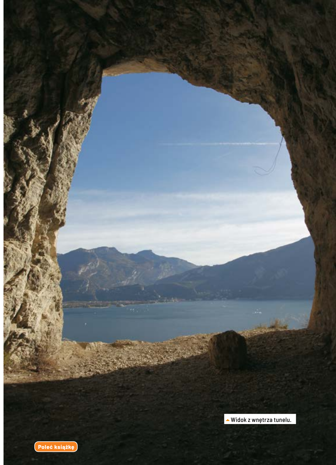
▲ Widok z wnętrza tunelu.