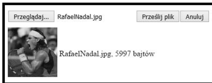
Rysunek 8.2. Przesyłanie plików na serwer z podglądem

Bardzo cenną i wygodną cechą komponentów do przesyłu plików jest możliwość wyświetlania podglądu obrazka przed jego przesłaniem na serwer. Poniższy rysunek 8.2 pokazuje rozwiązanie, które zaimplementujemy w tym punkcie rozdziału.