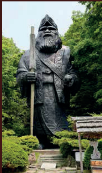
▲ Posąg jednego z ajnuskich bóstw