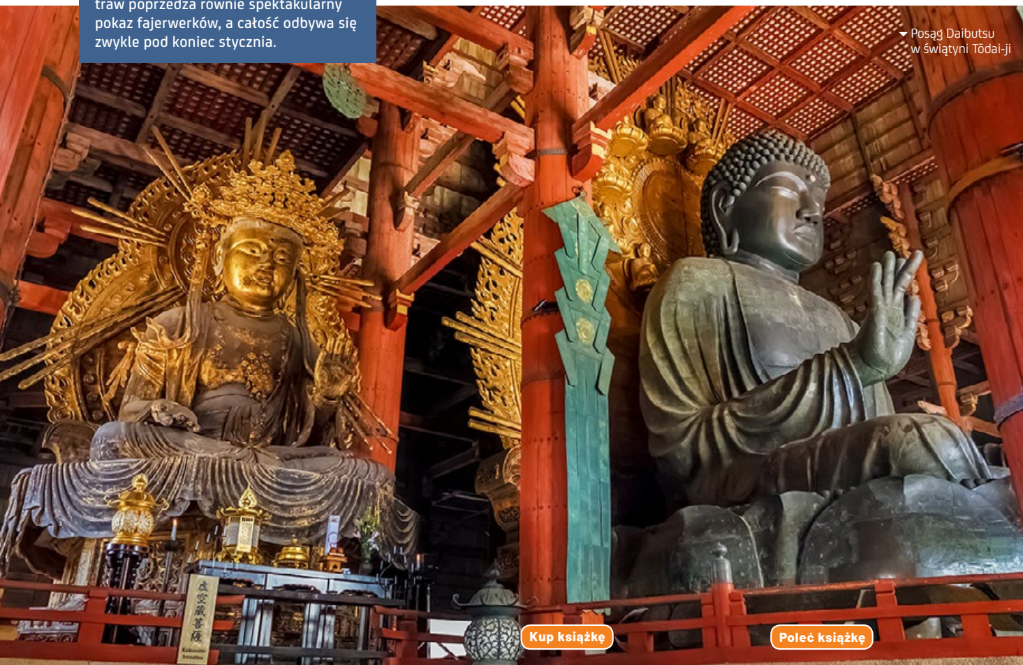
▼ Posąg Daibutsu w świątyni Tōdai-ji

klanu Fujiwara. W skład kompleksu wchodziło wtedy ponad 150 budowli, z których do dziś zachowała się tylko część. Pięciokondygnacyjna pagoda należy do najwyższych w Japonii (50 m) i jest symbolem miasta. Centralny Złoty Pawilon , odbudowany z rozmachem po pożarze, który strawił go kilka stuleci temu, i Wschodni Złoty Pawilon to dwie największe konstrukcje na terenie świątyni. Ta druga powstała na polecenie cesarza Shōmu, który nakazał jej budowę z intencją uzdrowienia swej chorej ciotki. Muzeum Skarbów Narodowych to jeszcze jeden obiekt z dużą liczbą buddyjskich dzieł sztuki.