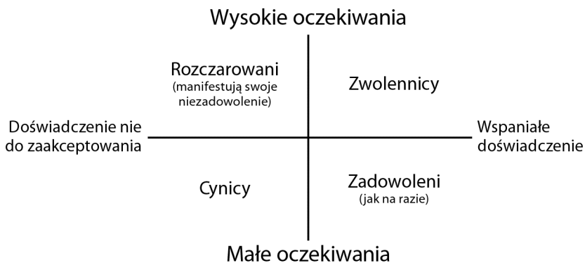
Rysunek 6.2. Spełnianie oczekiwań

Musisz spełniać oczekiwania ludzi. I aby to zrobić, musisz właściwie określić to, kim są. Następnie nie składaj nierealnych obietnic i pracuj nad przekraczaniem tych oczekiwań (patrz rysunek 6.2).