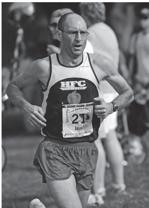
System biegania adaptacyjnego pozwala stale utrzymywać wysoki poziom ogólnej sprawności