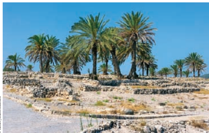
■ Ruiny Megiddo

Ponad żyzną doliną Jezreel, rozciągającą się na wschód od pasma góry Karmel, na niewysokim wzgórzu Megiddo w pobliżu skrzyżowania szos nr 66 i 65 znajduje się ważne stanowisko archeologiczne wpisane na Listę Światowego Dziedzictwa Kulturalnego i Przyrodniczego UNESCO.