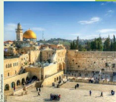
Stare Miasto w Jerozolimie

Niewielki Izrael to kraj kontrastów i niesamowitej różnorodności – prawdziwy tygiel kultur, religii i narodów. To także arena trudnego i trwającego od ponad pół wieku konfliktu między Izraelczykami a Palestyńczykami. Ale choć doniesienia o krwawych wydarzeniach na tym skrawku Bliskiego Wschodu nieraz przewijały się we wszystkich światowych mediach, to na miejscu okazuje się, że odwiedzamy bezpieczny i przyjazny kraj, prawdziwą wakacyjną ziemię obiecaną.