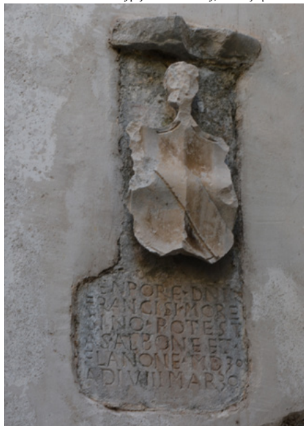
Inskrypcja na dzwonnicy, elewacja północna