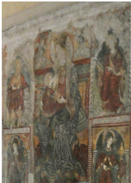
Fresk (tryptyk) z 1475, autorstwa Alberta z Konstancji

Renesansowy ołtarz główny pochodzi z lat 1641–1648. W dolnej części, z lewej strony, jest figura św. Jerzego na białym koniu.