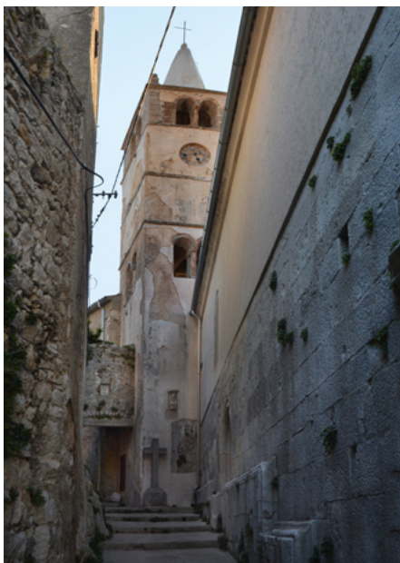
Dzwonnica i brama miejska, elewacja północna