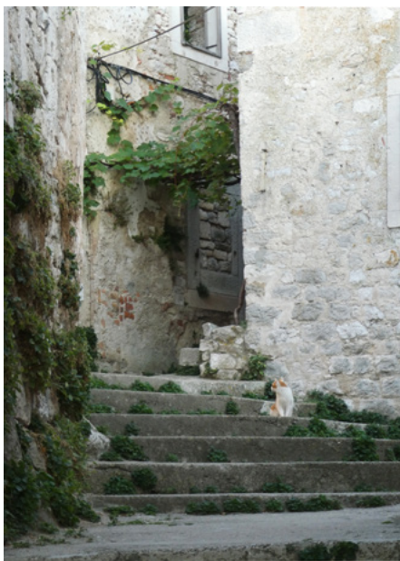
Część południowa, za bramą wewnętrzną