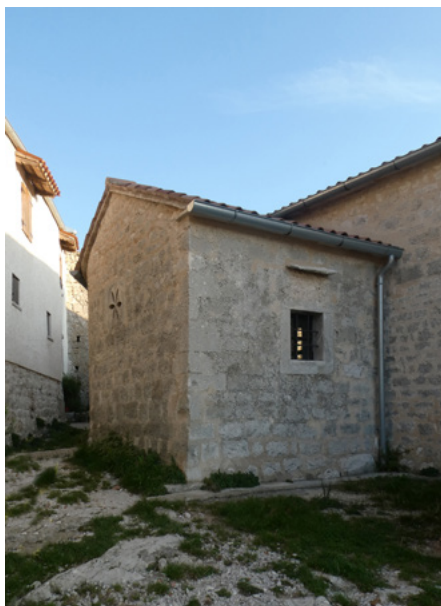
Zakrystia, elewacja północna

Inskrypcja z XI w. na elewacji południowej