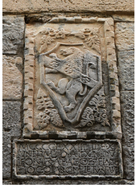
Kartusze herbowe na wschodniej elewacji nawy

To świątynia jednonawowa. W okresie baroku została rozbudowana w kierunku zachodnim.