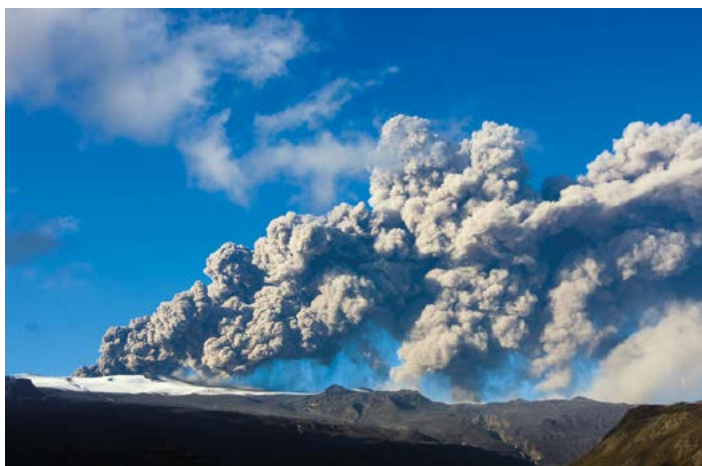
▲ Erupcja wulkanu Eyjafjallajökull