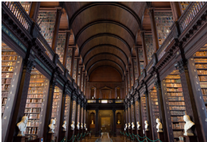
▲ The Long Room

normalny, 5 EUR ulgowy, w którym raz na kilka miesięcy studenckie kółko teatralne wystawia nowe sztuki. Warto śledzić stronę internetową, gdyż są na niej zamieszczane informacje dotyczące bieżących przedstawień.