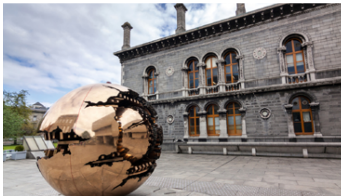
▲ Zabytkowe zabudowania Trinity College

Trinity College zajmuje teren o powierzchni ponad 47 akrów (190 tys. m 2 ) przy placu College Green. W jego obrębie mieszczą się: kampus akademicki, zabytkowa biblioteka, teatr publiczny,