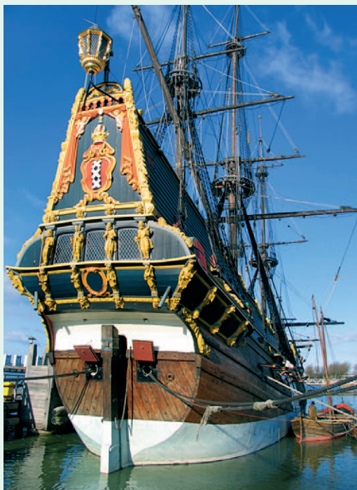
Statek VOC „Batavia”

Zamieszki w maju 1998 r. (1,2 tys. ofiar śmiertelnych i 5 tys. zniszczonych lub uszkodzonych budynków) były dla miasta wydarzeniem traumatycznym, takiej przemocy nie zaznano tutaj od ponad 30 lat. Punktem kulminacyjnym studenckich protestów było zajęcie parlamentu, które po kilku dniach doprowadziło do dymisji gen. Suharto. To jeden z ostatnich tragicznych epizodów w historii stolicy. Od tamtej pory Dżakarta pulsuje nowym, demokratycznym rytmem.