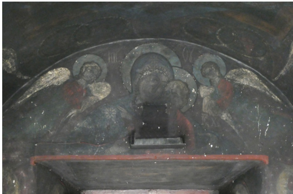
Polichromie w kruszynie

Świątynia jest nietypowym połączeniem gotyku (absyda i wieża dzwonicza) z architekturą bizantyjską.