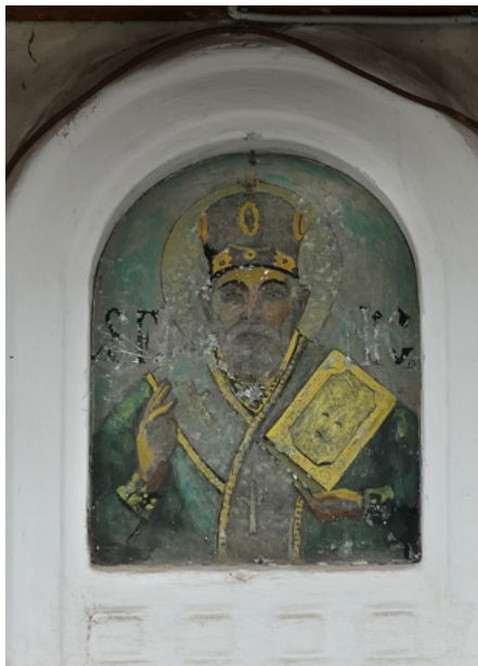
Wizerunek św. Mikołaja na dzwonnicy (elewacja zachodnia)

Cztery potężne filary podtrzymują kopułę. Drewniany, rzeźbiony ikonostas został wykonany w XVIII w.