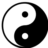
Symbol Yin i Yang

Niektórzy ludzie są bardziej Yang, a inni bardziej Yin. Zazwyczaj człowiek posiada cechy obu elementów (cechy mieszane), np. ciało bardziej typu Yin, a osobowość bardziej typu Yang, itd.