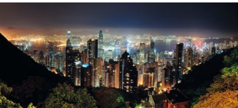
Zapierający dech w piersiach widok z Victoria Peak

W południowej części Dystryktu Centralnego – kolejka: odjazdy co 10–15 min od 7.00 do 24.00 – 33 HKD (ok. 12 EUR) w obie strony. Końcowy przystanek kolejki na Victoria Peak znajduje się przy Garden Rd, na południe od katedry św. Jana. Przy dobrej pogodzie warto wejść na Peak Tower, skąd rozciąga się wspaniała panorama.