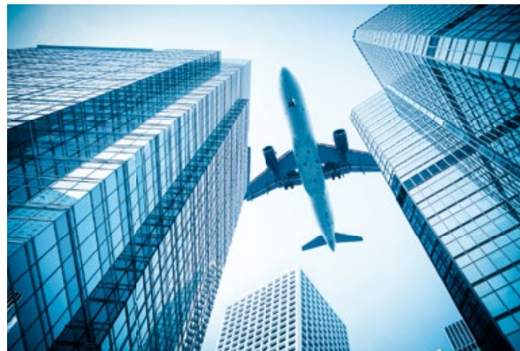
Wieżowce zdają się sięgać nieba

Obecny pomnik na Statue Square ★ przedstawia Sir Thomasa Jacksona, dyrektora The Hongkong and Shanghai Banking Corporation (HSBC). To on sprawił, że u schyłku XIX w. HSBC został największym bankiem Azji. Plac zawdzięczał nazwę pomnikowi królowej Wiktorii, który po zakończeniu II wojny światowej został przeniesiony do Victoria Park. Przy Statue Square wznoszą się Mandarin Oriental, jeden z najbardziej prestiżowych hoteli w Hongkongu, oraz inspirowany neoklasyzcizmem budynek Legislative Council (LEGCO Building) z 1912 r., będący siedzibą hongkońskiego ciała ustawodawczego. Na dachu tego ostatniego powiewa flaga Chińskiej Republiki Ludowej i flaga Hongkongu, przedstawiająca kwiat Bauhinia blakeana (miejscowe drzewo) na czerwonym tle.