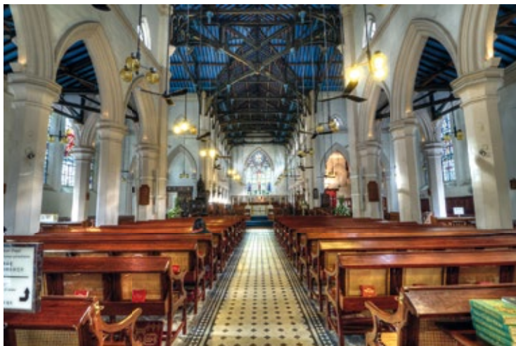
Wnętrze katedry św. Jana

Przed przejściem do ogrodu zoologicznego warto zatrzymać się przed Government House z 1855 r. ( Upper Albert Rd ), kolonialnym pałacem, który był oficjalną rezydencją Donalda Tsanga, chińskiego polityka i szefa władz wykonawczych Hongkongu do 2012 r. Również ten budynek pojawia się w dyskusjach na temat feng shui, częstych w Hongkongu. Topole otaczające siedzibę dawnego rządu kolonialnego tworzą barierę ochronną przed szkodliwym wpływem jakoby godzącej w nią groźnej sylwetki Bank of China. Chodzą również słuchy, że pierwszy szef władz wykonawczych Tung Chee-hwa w obawie przed złym feng shui odmówił mieszkania w tym miejscu.