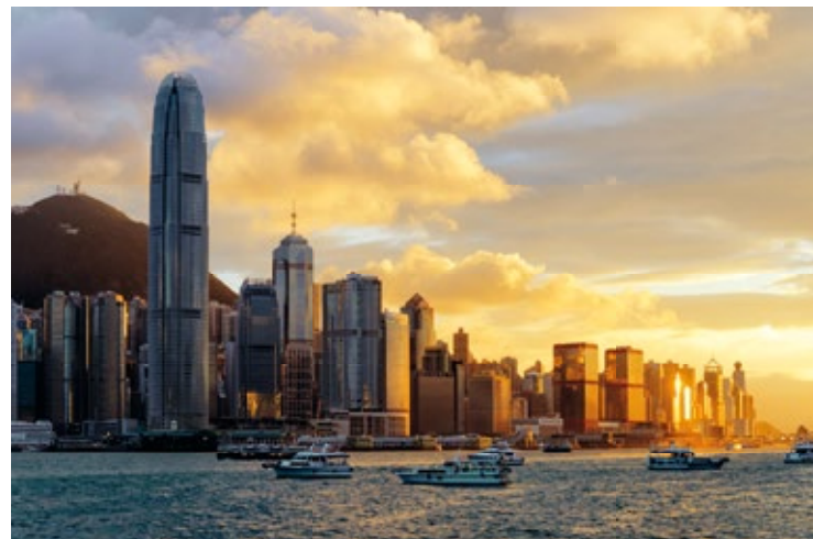
Widok na Hongkong, w tle Victoria Peak

Kolejka o nazwie Peak Tram działa od 1884 r. Została zbudowana przez właściciela hotelu na wzgórzu, który chciał dać swoim gościom łatwy i szybki dostęp na górę, wygodniejszy niż krzesła noszone przez tragarzy. W 1888 r. na mocy decyzji gubernatora kolejkę otwarto dla wszystkich. Od tego czasu dwa wagoniki Peak Tram przewożą niestrudzenie pasażerów na wierzchołek góry.