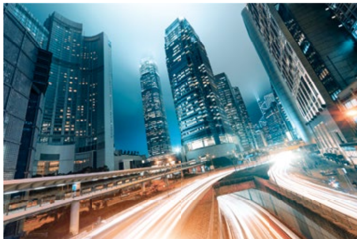
Modernistyczna architektura jest znakiem rozpoznawczym Hongkongu

Do Statue Square prowadzi jedna z wielu dróg napowietrznych , przecinających dzielnicę. Aby tam dotrzeć, należy przejść przez IFC Mall, którego wieża nr 2 jest jedną z najwyższych w Hongkongu i wznosi się na 420 m. Obok, na Exchange Square , znajdują się przystanki licznych autobusów kursujących po wyspie oraz Giełda Papierów Wartościowych w Hongkongu, będąca jednym z najważniejszych centrów finansowych świata.