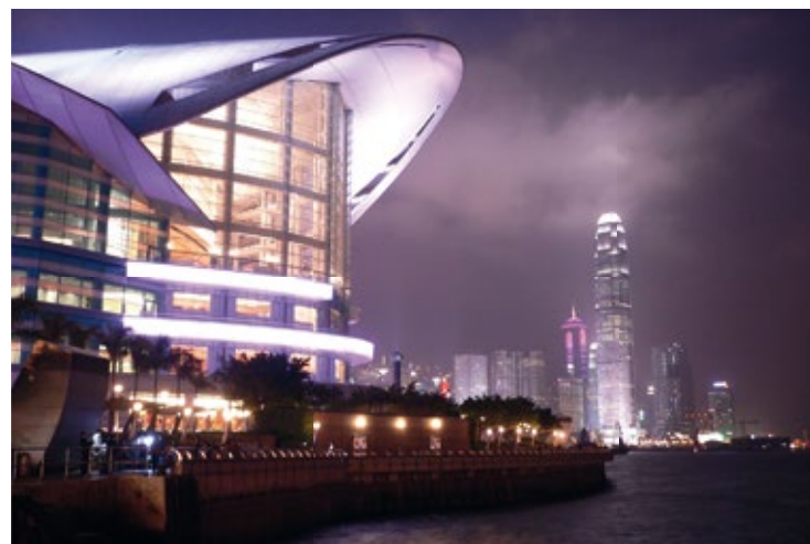
Nocna panorama Wan Chai

Nad dzielnicą góruje Central Plaza (B2), gmach wznoszący się na 78 pięter (na wysokość 374 m). Mieszkańcy Hongkongu zawsze skorzy do drwin z nowych gmachów zmieniających pejzaż miasta nazywają go „wielką strzykawką”. Z dostępnego dla zwiedzających 46. piętra można podziwiać panoramę dzielnicy.