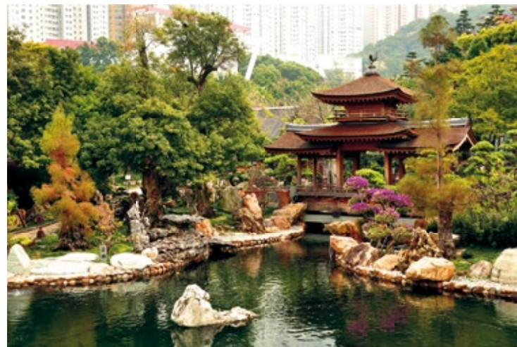
Rajski ogród pośród labiryntu wieżowców

Z kolei w Edward Youde Aviary ★ (尤德爵士觀鳥園, 9.00–17.00 – wstęp wolny) można obejrzeć ponad 800 gatunków ptaków. Ptaszarnia nosi imię Edwarda Youde, byłego gubernatora Hongkongu. Dwie kładki napowietrzne umożliwiają obserwowanie ptaków