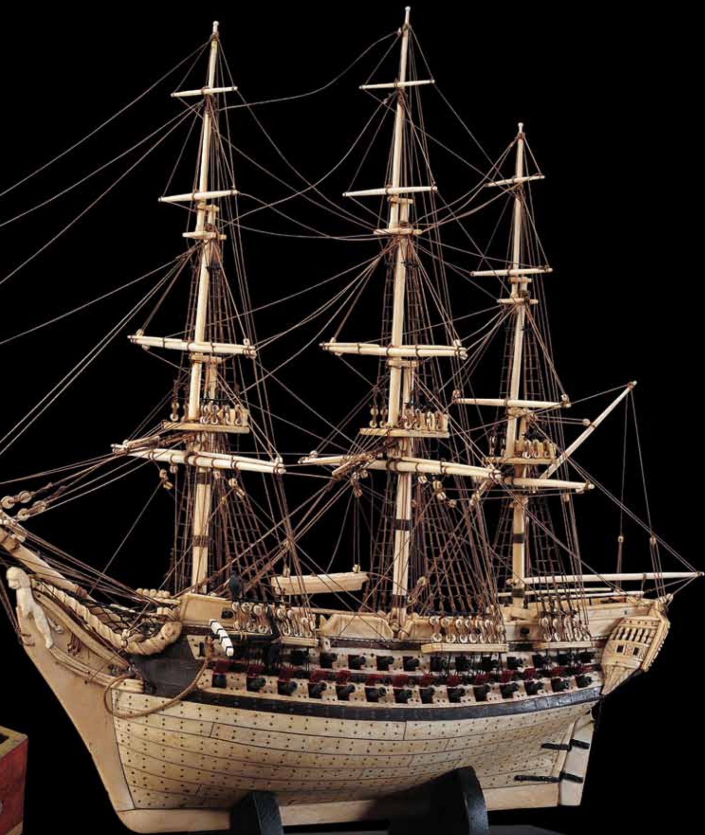
Model made by French prisoners from the HMS Stapledon , when held captive in Britain, 1794-1807