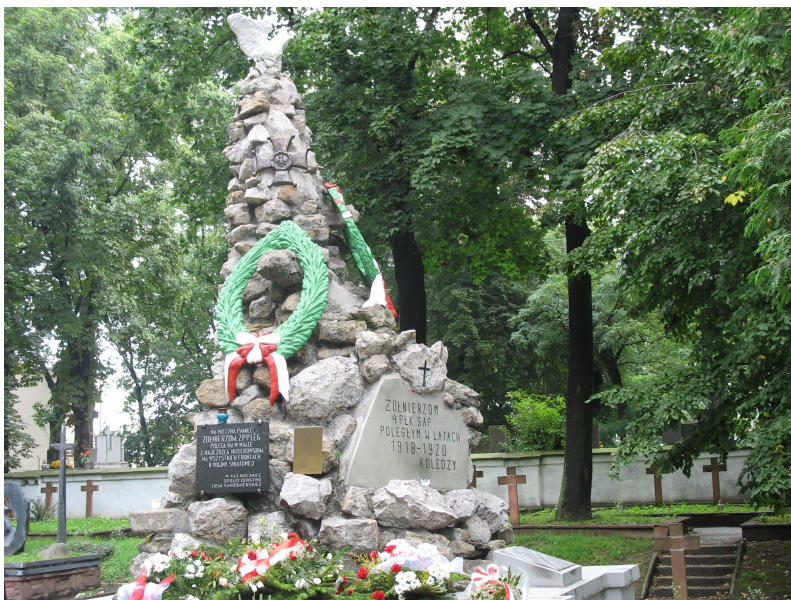
Pomnik żołnierzy garnizonu sandomierskiego na cmentarzu wojskowym w Sandomierzu przy ul. Mickiewicza