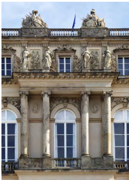
Skrzydło zachodnie, elewacja zachodnia