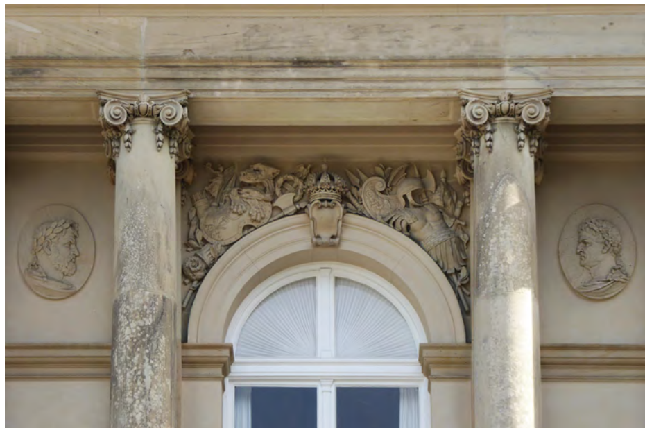
Fragment ryzalitu południowego

Okna elewacji zachodniej są bogato zdobione w przyłęczach, istotnym motywem są płaskorzeźbione elementy uzbrojenia.