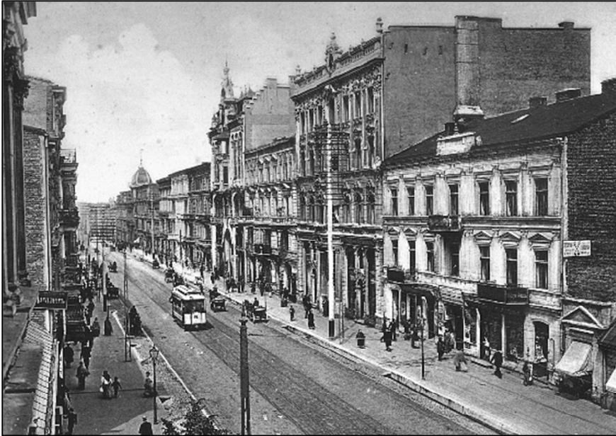
Fot. 1. Ulica Piotrkowska w 1896 r.

ponadlokalnej działalności na terenie miasta licznych (116 w 1897 r.) oddziałów firm handlowych i ubezpieczeniowych, których główne siedziby znajdowały się na obszarze Królestwa Polskiego i Rosji.