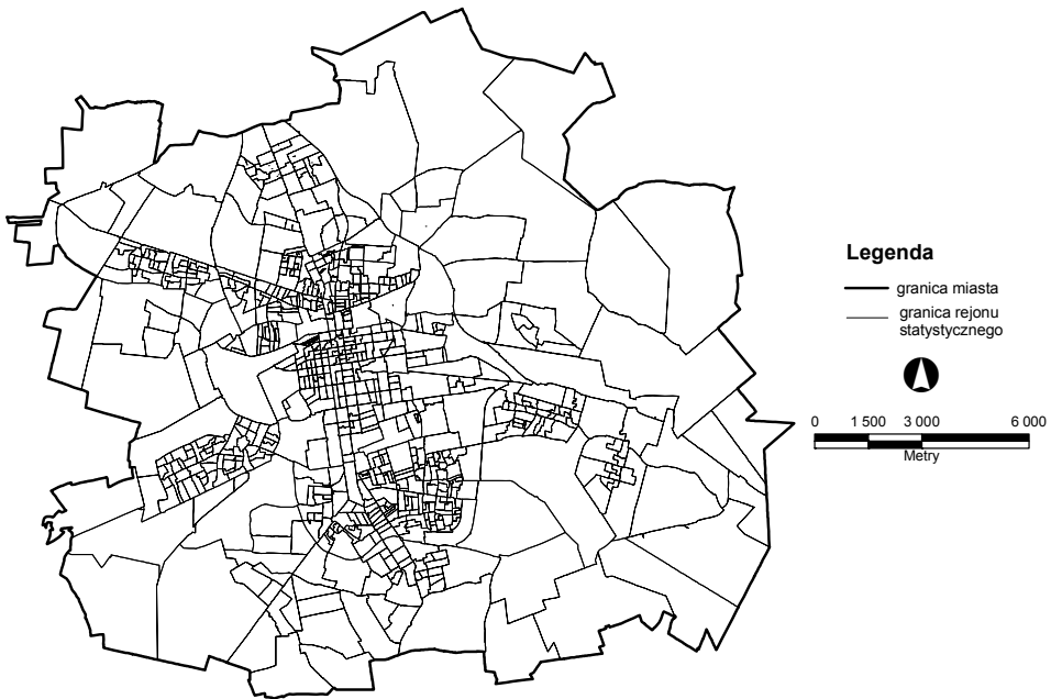
Rys. 2. Podział Łodzi na rejonu statystyczne