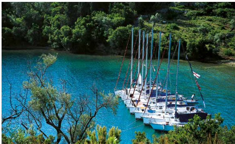
Lepiej razem niż samotnie: flotylle są często spotykane na Morzu Jońskim

Ci, którzy samodzielnie czarterują jacht, mogą w szczycie sezonu