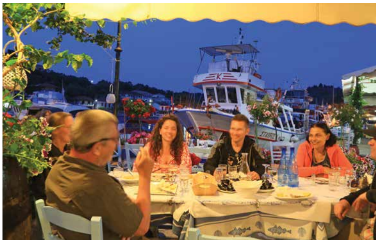
Kolacja w tawernie z widokiem na port – idealne zakończenie dnia żeglugi. Tutaj w Vathi na wyspie Meganisi

i zalewająca informacjami załogę planującą krótki rejs czarterowy, żeby w końcu zostawić ją samą przy obmyślaniu trasy. Takie grube tomy i tak są standardowym wyposażeniem każdego jachtu czarterowego. Ta książka ma na celu przedstawienie najciekawszych miejsc i zasugerowanie trasy, bez nakłaniania do jej wyboru pod niewolniczym przymusem, jak ma to miejsce w rekomendacjach wielu firm czarterowych. Przewodnik nie unika ciekawostek i opowieści, które przydają kolorytu i treści omawianemu akwenowi, nie zaniedbując podawania informacji o tym,