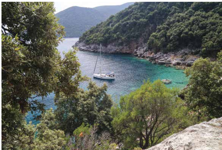
Jacht w zatoce Antisamos na wyspie Kefalonia

czasem się zirytować, gdy wszystkie miejsca w niektórych portach lub zatoczkach okazują się zajęte przez flotyllę. W rzeczywistości jednak zła reputacja załóg flotylli bywa niezastużona. W każdym razie hałaśliwe hordy imprezujące do późna w nocy i głośno rozmawiające na sześciu jachtach nie są częstsze niż wśród „normalnych” załóg czarterowych.