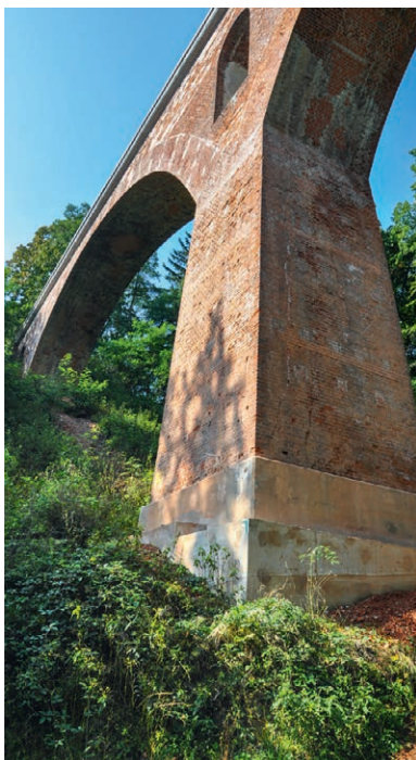
▶ Wiadukt na trasie Kolei Sowiogórskiej

Bardzo odżywcze są bukowe orzeszki, zawierają dużo tłuszczu, ale także substancję halucynogenną: faginę. Nie można ich zatem zjeść zbyt dużo. Z bukwi toczy się również oleje, zarówno jadalne, jak używane jako opał. O bukach pisał w swoich dziełach Adam Mickiewicz, chociaż zapewne znać je musiał ze szkoły, gdyż na Litwie drzewa te nie występują.