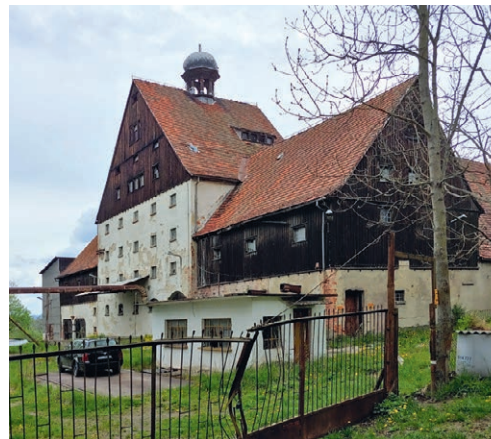
► Dawny młyn w przysiółku Księżno

Wędrując szlakami w okolicach Nowej Rudy, możemy natknąć się na budzący ciekawość charakterystyczny czerwony kolor podłoża. Okoliczne twory geologiczne noszą nazwę czerwonego spągowca, a barwę zawdzięczają m.in. efektowi wietrzenia skał w gorącym i suchym klimacie. Osady te gromadziły się w niecce śródsudeckiej około 270 mln lat temu. Należą do nich m.in. piaskowce, które przybierają kolory od jasnoczerwonego do bardzo intensywnie zabarwionego. Skała jest twarda i trudna w obróbcę, ale za to dość odporna na warunki atmosferyczne. Ze względu na te właściwości i niewątpliwe walory dekoracyjne skał tych powszechnie używano w budownictwie. Z utworów czerwonego spągowca zbudowane są m.in. elementy srebrnogórskiej twierdzy, most Zwierzyniecki we Wrocławiu oraz wiele budynków w Nowej Rudzie.