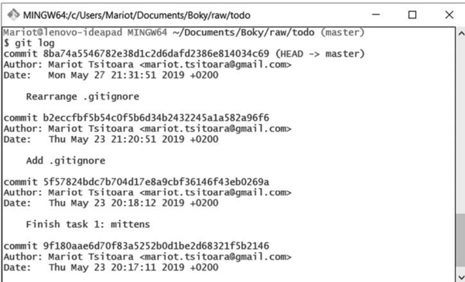
Rysunek 5.3. Sprawdzenie historii commitów poleceniem git log

Do perfekcji. Skoro już wiemy, że katalog roboczy jest czysty, nadszedł czas, aby przejrzeć historię i zorientować się, który commit należy cofnąć. Powinniśmy otrzymać rezultat taki jak na rysunku 5.3.