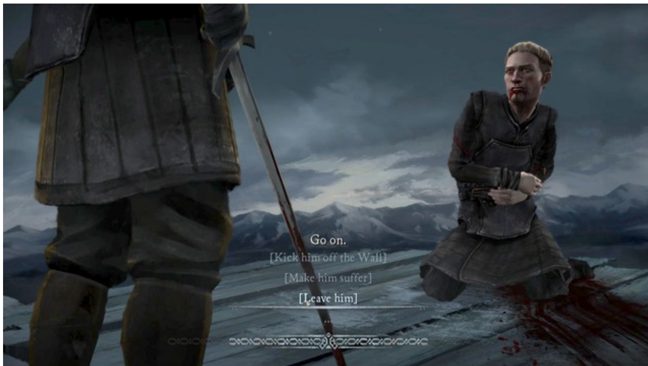
Ważny wybór #3

Trzeci ważny wybór znajdziesz w piątym rozdziale tego epizodu. Do ciebie należy decyzja czy zostawić Britta przy życiu czy go zamordować. Po wyborze do miejsca zdarzenia przybiegnie Finn dlatego jeżeli złożyłeś przysięgę Jonowi Snow , dobrym wyborem jest zostawienie Britta przy życiu.