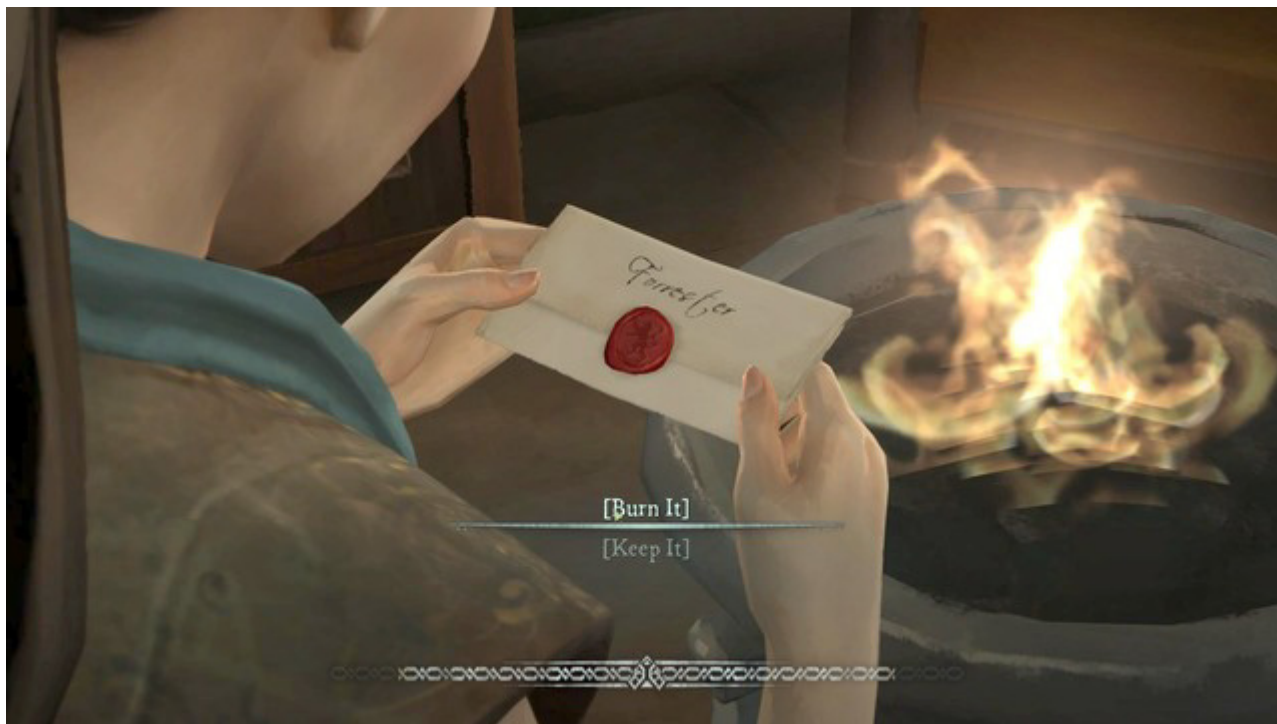
Ważny wybór #5

Ostatni ważny wybór odnosi się do Miry i dekretu wydanego przez Tyriona Lannistera . Do ciebie należy decyzja czy go zachować czy spalić. Zachowanie dekretu narazi cię na powiązanie z Tyrionem Lannisterem (po tym jak został oskarżony o zamordowanie króla Joffreya ) a spalenie go spowoduje, że będziesz musiał znaleźć inny sposób na pomoc swojej rodzinie. Niezależnie od wyboru, konsekwencje zobaczysz w następnym epizodzie.