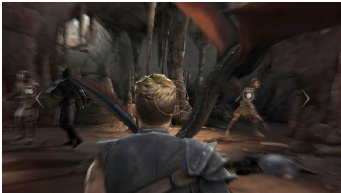
Ważny wybór #1

Pierwszy ważny wybór znajdziesz w pierwszym rozdziale gry. Do Ciebie należy sytuacja komu udasz się na ratunek. Niezależnie jednak od przedstawionej ci sytuacji, nikt nie zginie i jedyną konsekwencją wyboru jest tutaj rozmowa z jednym z nich w końcowych rozdziałach tego epizodu.