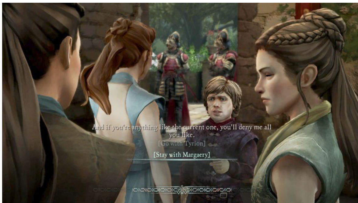
Ważny wybór #2

Drugi ważny wybór znajdziesz na początku czwartego rozdziału tego epizodu. Do ciebie należy decyzja czy udasz się z Lorderm Tyrionem czy zostaniesz wierny Margaery i zostaniesz z nią. Niezależnie od wyboru Margaery będzie na ciebie wściekła lecz nie zauważysz tych konsekwencji w tym epizodzie