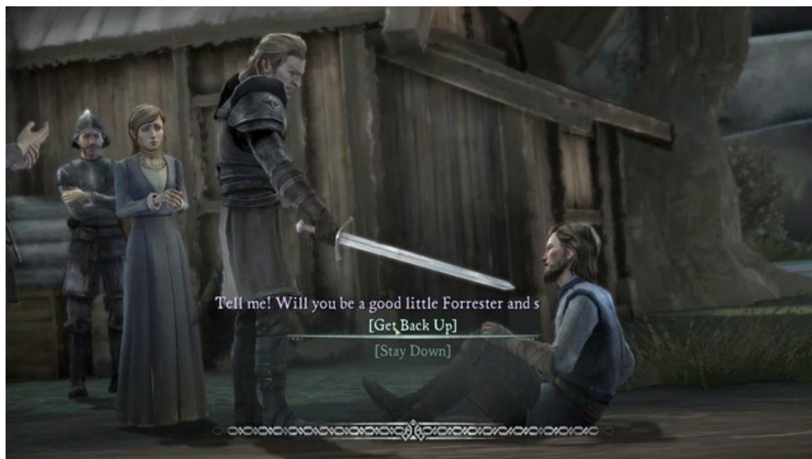
Ważny wybór #4

Przedostatni ważny wybór znajdziesz w piątym rozdziale gry. Do ciebie należy decyzja czy przeciwstawisz się nieproszonemu gościowi, Gryffowi i pokażesz wszystkim wokół, że nikt nie będzie tobą pomiatał czy przełkniesz dumę i zostaniesz poniżony. Niezależnie, którą opcję wybierzesz, nie zauważysz żadnych konsekwencji wyboru w tym epizodzie.