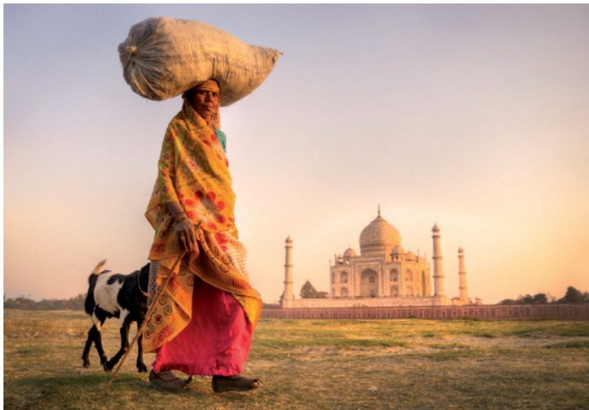
4.45. ISTOCKPHOTO/© Robert Churchill, # 11612894