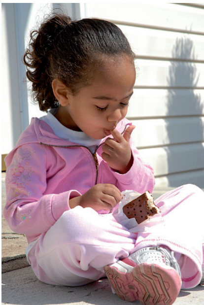
4.56. ISTOCKPHOTO/© Gerville Hall, # 3100394