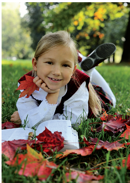
4.52. ISTOCKPHOTO/© Maria Pavlova, # 10509971