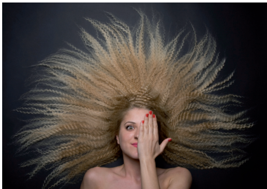
4.43. ISTOCKPHOTO/© Hüseyin Tuncer, # 9194130