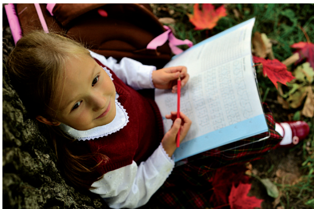
4.51. ISTOCKPHOTO/© Maria Pavlova, # 10443084