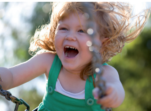
4.55. ISTOCKPHOTO/© Mark Evans, # 5764767

Najwięcej uroku w przypadku dzieci mają fotografie niepozowane. Takie, które pokazują emocje od radości do smutku, a także zdjęcia robione w sytuacjach codziennych, kiedy dzieci nie wiedzą, że są podglądane (fotografie 4.55 i 4.56).