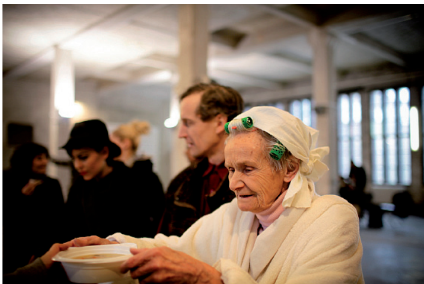
4.44. ISTOCKPHOTO/© H el ene Vall ee, # 8380994