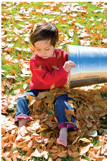
4.48. ISTOCKPHOTO/© SFB Photographics Inc., # 11024296

Podczas fotografowania dzieci zwykle trzeba działać szybko, gdyż rzadko pozostają one nieruchome, zwłaszcza gdy są pochłonięte zabawą (fotografia 4.48). Ruch to jest to, co w pełni oddaje na fotografii ich spontaniczność i energię. Fotografując dzieci w ruchu, można uzyskać dwa efekty: „zamrożenie” ruchu lub obraz częściowo