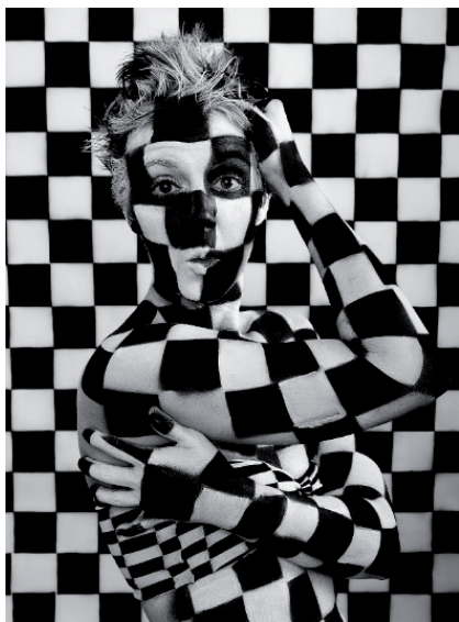
4.41. ISTOCKPHOTO/© Renee Lee, # 12105106

Portrety kreatywne są jednym z rodzajów zdjęć pozowanych. Wykonujemy je w celu zaznaczenia wykreowanego wyglądu, podkreślenia pewnych cech lub wykorzystania modela do utworzenia kompozycji graficznej (fotografie 4.41 – 4.43). Nie mają one na celu zaakcentowania indywidualnych cech fotografowanej osoby. Najważniejszą rolę w tego rodzaju zdjęciach odgrywają: makijaż, rekwizyty, uczesanie oraz ubranie — a raczej kostium, to właściwsze określenie. Za pomocą tych elementów można zmieniać diametralnie charakter zdjęcia. Wszystko zależy od inspiracji i wyobraźni fotografa oraz talentu modela. W przypadku tego rodzaju obrazów niebagatelną rolę odgrywa dobry kontakt fotografującego z fotografowanym.