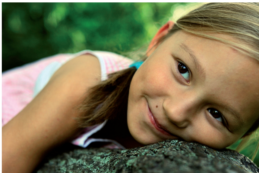
4.54. # 10479207

Najwięcej uroku w przypadku dzieci mają fotografie niepozowane. Takie, które pokazują emocje od radości do smutku, a także zdjęcia robione w sytuacjach codziennych, kiedy dzieci nie wiedzą, że są podglądane (fotografie 4.55 i 4.56).