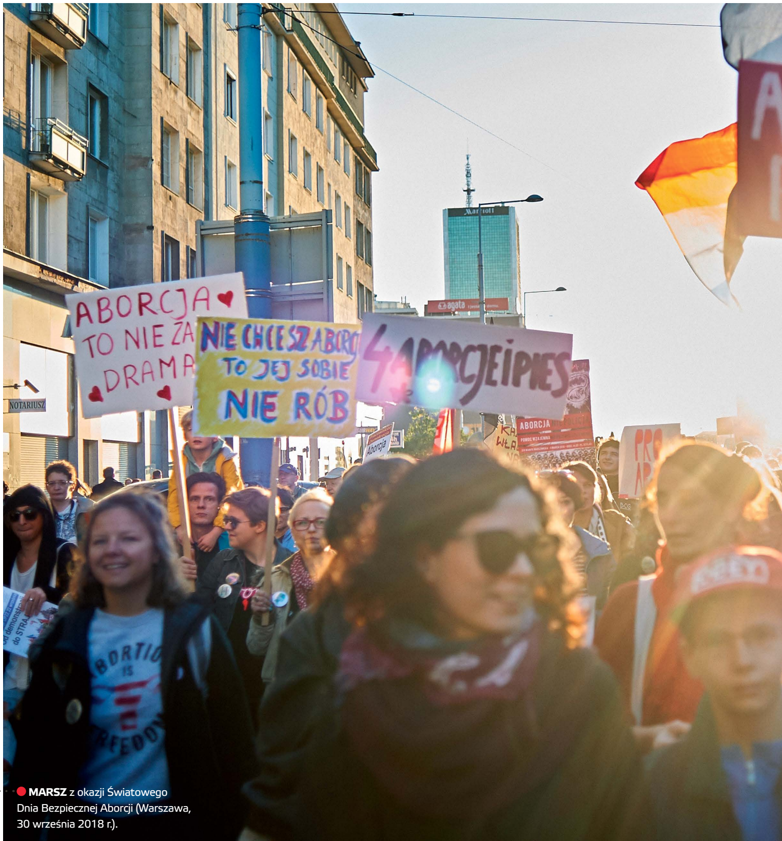
● MARSZ z okazji Światowego Dnia Bezpiecznej Aborcji (Warszawa, 30 września 2018 r.).