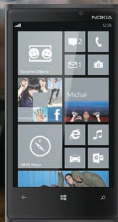
Nokia Lumia 920