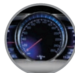
Cyfrowe zegary Active TFT