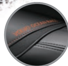
Ekscyzywna skórzana tapicerka z przeszyciami Volvo Ocean Race