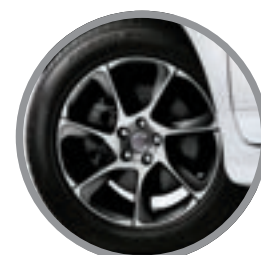
Specjalnie zaprojektowane felgi Portunus