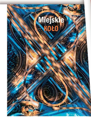
10 Jak działa... 42