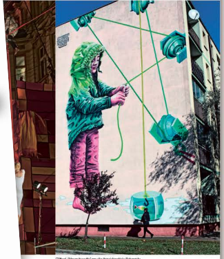
18 Jak zbierać wiatr... 95

P ROBLEMY W MIEŚCACH SĄ WIELKIE. WSKAZANIE NA POPRAWIAN... OPÓRZĄC ... 16