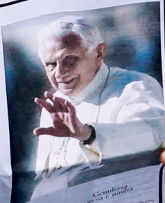
Centenario della nascita di San Giuseppe

«Dio è amore, la chiave del pontificato»