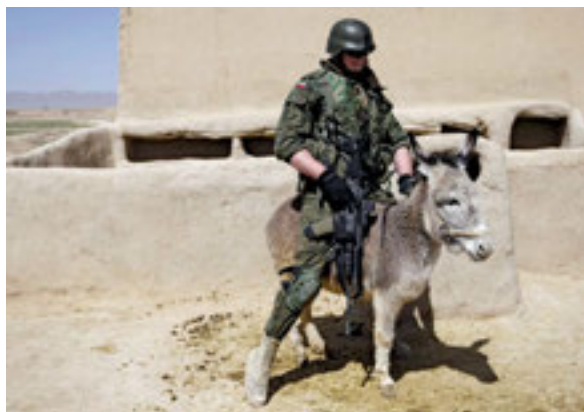
24 RAPORT: Swojskie wojsko