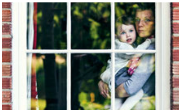
28 Odbierane dzieci