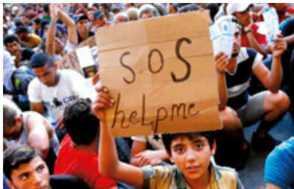
8,46 Uchodźcy mogą się przydać