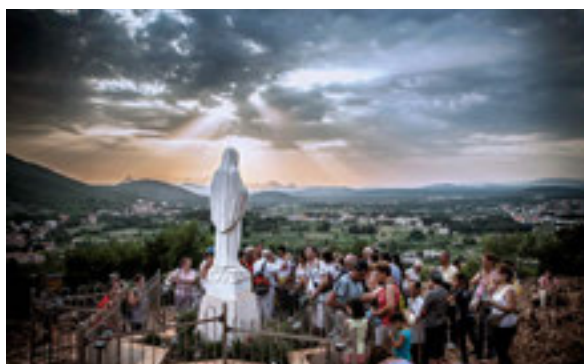
50 Medziugorie: pożyteczna herezja?