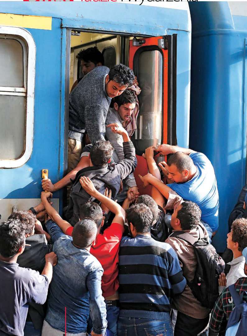
3 mln uchodźców, koczujących dziś w Turcji i Libanie, może wkrótce ruszyć do Europy.

► Takie rozwiązanie miałyby też inną zaletę. Ponieważ dziś w praktyce jedyną legalną drogą osiedlenia się w Unii Europejskiej jest system azylowy, korzystają z niego masowo również imigranci zarobkowi z różnych rejonów Azji i Afryki (podając się często za Syryjczyków). W efekcie system jest sparaliżowany, bo nie jest w stanie rozpatrzyć takiej liczby wniosków. Jeśli Europa zaproponowałaby legalną drogę dla tej drugiej grupy, choćby w postaci loterii zielonych kart, zapewne udałoby się odblokować procedury azylowe, a to one, w kontekście wojen w Syrii, Iraku i Libii, powinny być dziś priorytetem z powodów humanitarnych.