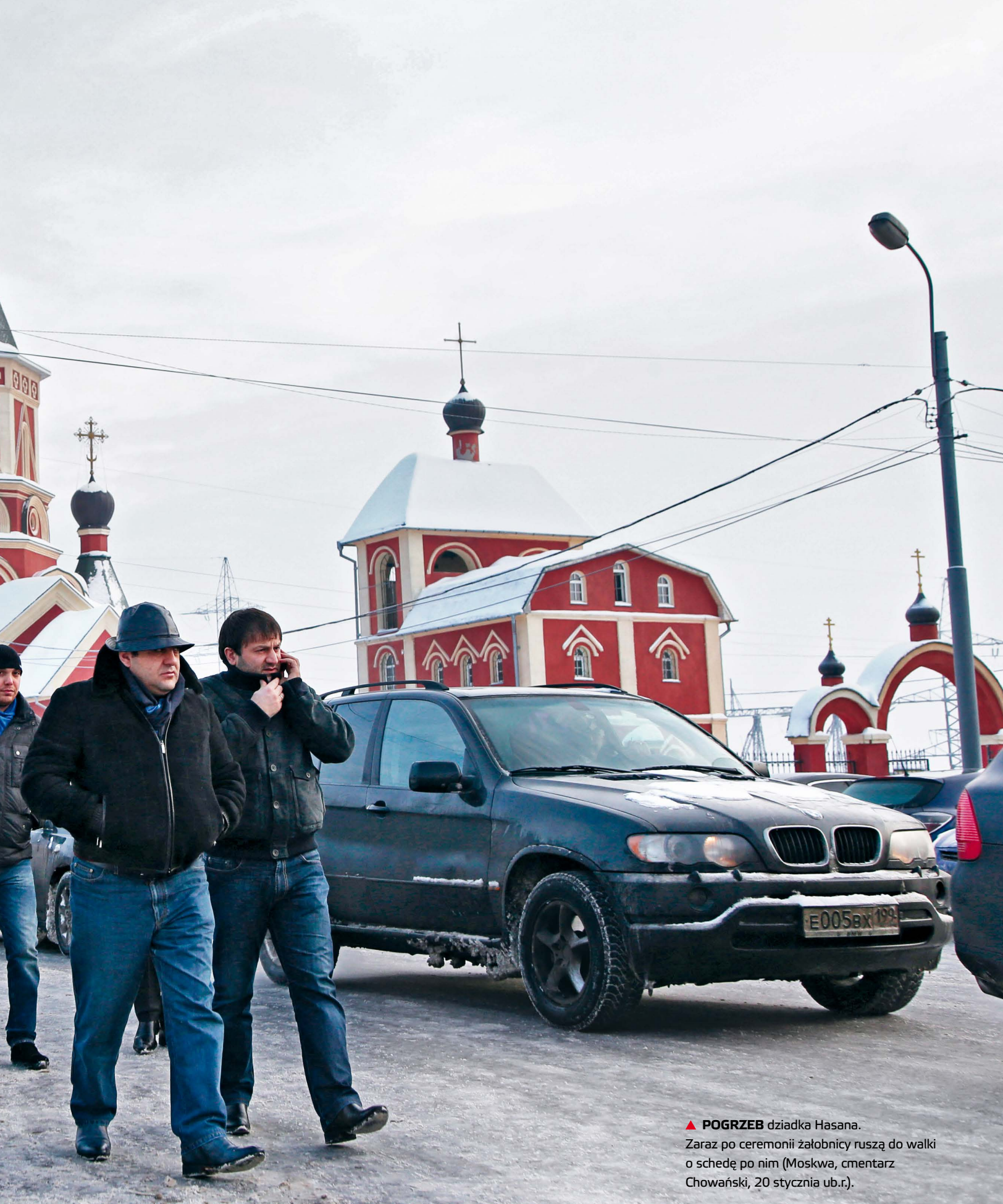
▲ POGRZEB dziadka Hasana. Zaraz po ceremonii żałobnicy ruszą do walki o schedę po nim (Moskwa, cmentarz Chowański, 20 stycznia ub.r.).