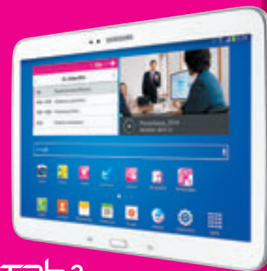
Samsung GALAXY Tab 3