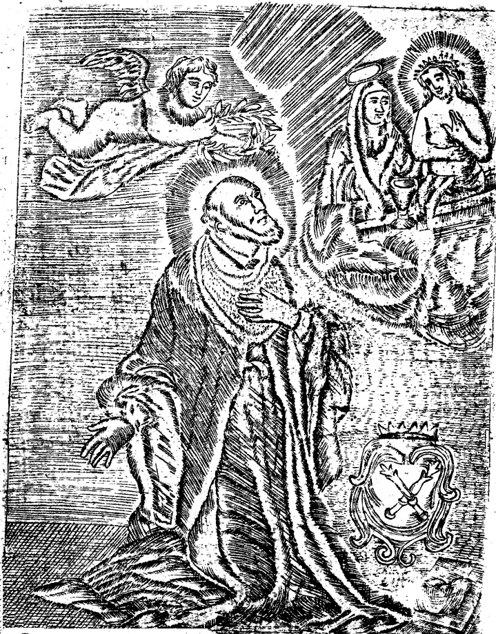
B. JOANNES CANTIVS Polonus S. Th. in Universitate Cracoviensi Doctor Presbyter Seculari, Romae A. D. 1688.