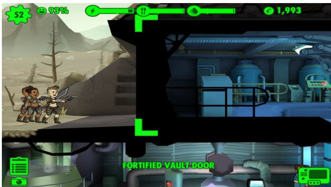
Ulepszenie drzwi da Ci czas na zorganizowanie obrony.

Klikając na którykolwiek z surowców skontrolujesz ich dokładny stan. Kreską oznaczone zostały limity, poniżej których miejsce mają negatywne efekty (utrata zasilania, spadek zdrowia mieszkańców, obrażenia spowodowane promieniowaniem). Podczas ataku nieprzyjaciół na Kryptę surowce mogą także zacząć mrugać na czerwony kolor - oznacza to, że są one od Ciebie wykradane (dlatego też zawsze jak najszybciej staraj się pokonać atakujących). W prawym górnym rogu znajdziesz jeszcze informację podsumowującą posiadany budżet [6] oraz "młotek" lub "strzałkę" [7] - kliknięcie w to miejsce otworzy odpowiednio menu budowy nowych pomieszczeń lub ulepszenia aktualnie zaznaczonego.