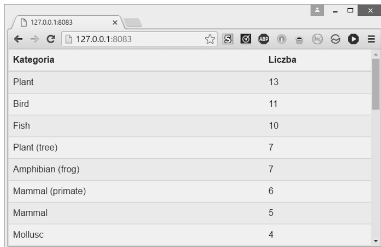
Rysunek 2.2. Witryna z lepszym formatowaniem utworzona za pomocą biblioteki Suave