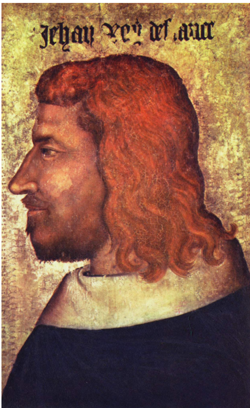
Jan II Dobry