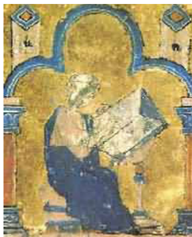
Wilhelm z Tyru

się zapoznał, choćby wtedy, gdy czytał je Amalrykowi. Zapewne wtedy król poprosił Wilhelma, by ten spisał także dzieje władców Wschodu. Praca ta powstała w oparciu o arabską kronikę Sa'ida Ibn Batrika, lecz nie zachowała się do naszych czasów. Była jednakże znana i wykorzystywana jeszcze w XIII wieku m.in. przez kronikarza i biskupa Akki Jakuba z Vitry 12 .