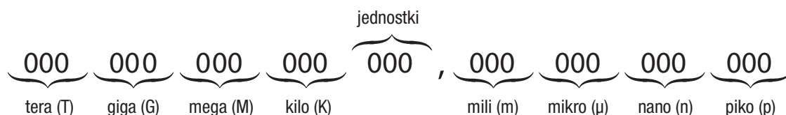
Rysunek 2.3 Wizualizacja typowych przedrostków jednostek

Aby przejść z jednostki podstawowej do jednostki z przedrostkiem, należy podzielić ją przez współczynnik konwersji. Tak więc, jeśli coś waży 35,2 grama, można przeliczyć to na kilogramy, dzieląc to przez 1000. 35,2 / 1000 = 0,0352 . Innymi słowy, 35,2 grama to tyle, co 0,0352 kilograma.