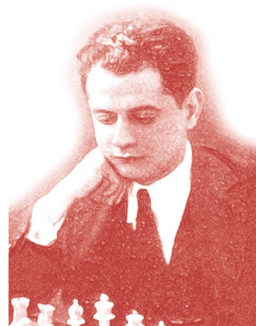
Хосе Рауль Капабланка і Граупера

Чому ж ми назвали цю необхідну передмову «Капабланка і Сухомлинський»?