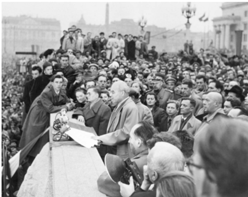
24.10.1956. Przemówienie powracającego do władzy I sekretarza KC Władysława Gomułki na Placu Defilad w Warszawie.

o zbliżaniu się do Warszawy wojsk Armii Radzieckiej. W trakcie tych rozmów wstrzymano ich marsz na stolicę, ale dopiero kiedy Chruszczow wrócił do Moskwy i zapoznał się ze stanowiskiem Chin, sprzeciwiającym się radzieckiej interwencji zbrojnej, wyszedł z Moskwy rozkaz powrotu tych wojsk do miejsc stacjonowania.