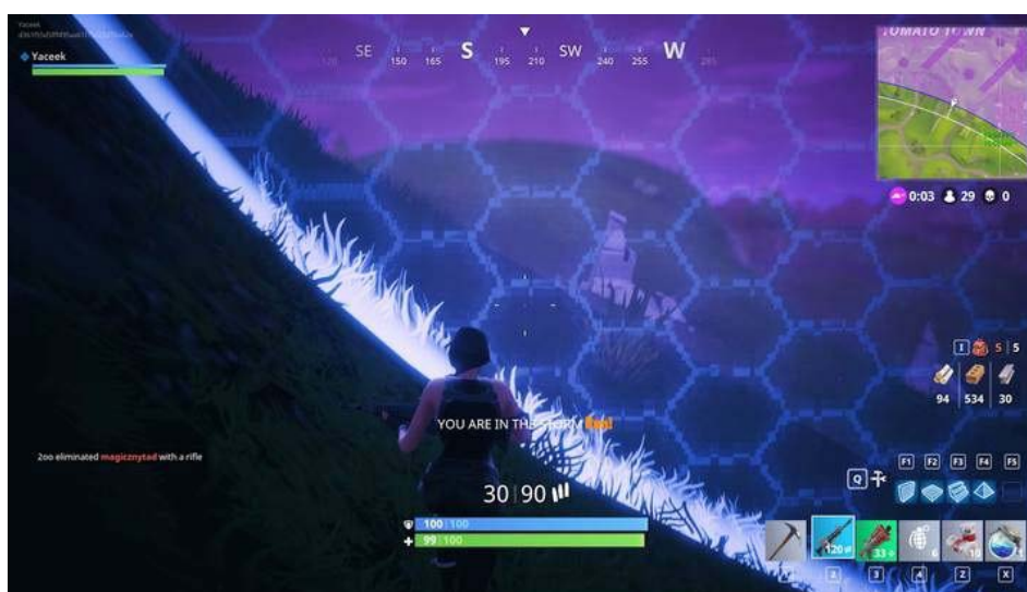
Będąc poza okręgiem, będziesz otrzymywać obrażenia.

Od początku zostaniesz przywitany ogromną mapą i to od ciebie zależy gdzie będziesz chciał wylądować. Strefa lądowania musi zapewnić ci pierwsze przedmioty (broń), by móc przeprowadzać dalszą eksplorację. Na początku staraj się poznać mapę i w każdym kolejnym meczu ląduj w inne miejsca. Miejsca oznaczone na mapie napisem lokacji są najbardziej popularne. Znajdziesz tutaj mnóstwo różnorodnego uzbrojenia, ale będziesz musiał walczyć o nie z innymi graczami próbujących robić dokładnie to samo.