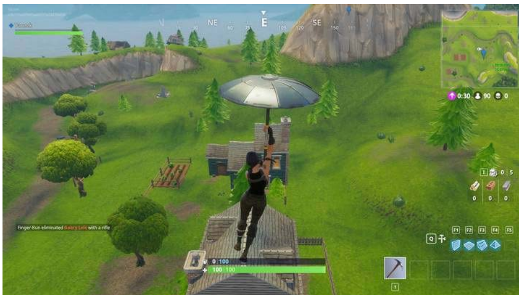
Wybór miejsca i lądowanie.

Od początku zostaniesz przywitany ogromną mapą i to od ciebie zależy gdzie będziesz chciał wylądować. Strefa lądowania musi zapewnić ci pierwsze przedmioty (broń), by móc przeprowadzać dalszą eksplorację. Na początku staraj się poznać mapę i w każdym kolejnym meczu ląduj w inne miejsca. Miejsca oznaczone na mapie napisem lokacji są najbardziej popularne. Znajdziesz tutaj mnóstwo różnorodnego uzbrojenia, ale będziesz musiał walczyć o nie z innymi graczami próbujących robić dokładnie to samo.