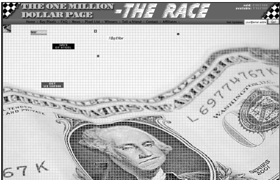
Rysunek 9.1. Prototyp — amerykański serwis onemilliondollarpage.com

W jakiś czas później piszący te słowa postanowił sprawdzić, czy rzeczywiście każdy amerykański pomysł przeniesiony na grunt polski może odnieść sukces. Powstał więc wzorowany na powyższym pomysle serwis DomZaMilion.pl (rysunek 9.2), który — mimo pewnych modyfikacji i zmiany koncepcji — miał bardzo podobny cel: sprzedać milion pikseli ujętych w tzw. cegły reklamowe. Aby dodać projektowi znamion społecznej odpowiedzialności biznesu, wyposażono go w możliwość zamieszczania bezpłatnych reklam przez fundacje i inne organizacje charytatywne; z kolei by podnieść atrakcyjność dla reklamodawców, ogłoszono konkurs z nagrodami o wartości 50 000 zł.