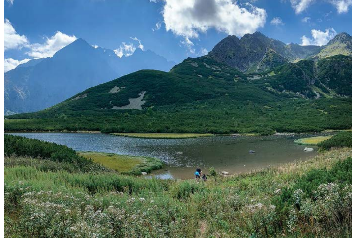
Dolina Białych Stawów Kieżmarskich

górną piętro Doliny Kieżmarskiej, od Zadnich Koperszadzów – odnogi Doliny Jaworowej. Nazwy tych dolin, zarówno polskie, jak i słowackie (Medódoly), związane są kopalnictwem rud miedzi, które prowadzili w tym rejonie Niemiec-gy górniczy ze Spiszu ( Kupferschächte to po niemiecku „szyby miedzi”). Przełęcz pod Kopą jest jednym z najdogodniejszych przejść przez grań Tatr – przez wieki korzystali z niego pasterze i myśliwi. Nad trawiastymi stokami otaczającymi przełęcz piętrzy się piramidalna sylwetka Jągnięcego Szczytu. Po drugiej stronie rozciąga się panorama najwyższych szczytów Tatr Bielskich z Szalonym Wierchem, Płaczliwą Skałą i Hawranem. Można zauważyć piętro-wą budowę stoków.