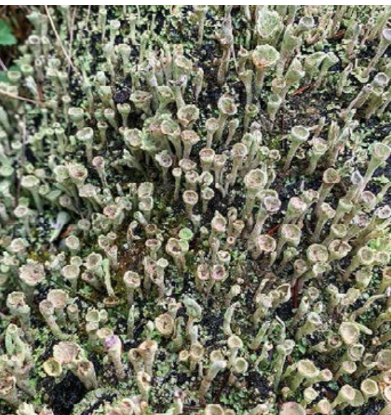
Porosty na kłodzie