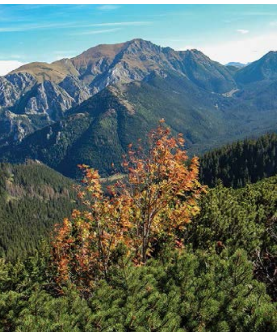
Barwy jesieni – jarzębina w kosodrzewinie

żerują licznie krzyżodzioby szyszkowe i czyże. W żlebach i na ścianach skalnych widoczne są lodospady, na granicach – potężne nawisy śnieżne.