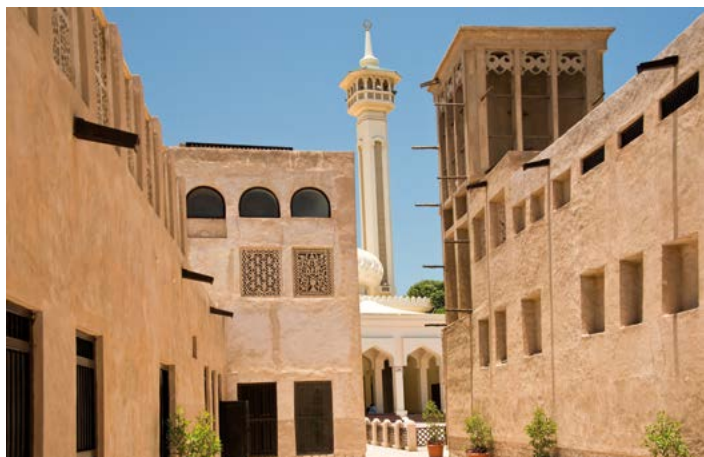
▲ Historyczna dzielnica Bastakiya, znana również jako Al Fahidi Historical Neighbourhood.

widok na pobliskie wieże i wąskie uliczki. Warto wstąpić również do galerii sztuki współczesnej Majlis Gallery 📍 www.themajlisgallery.com ; otwarte: sb.–czw. 10.00–18.00. W galerii znajdziemy eklektyczny zbiór prac ponad 60 współczesnych artystów z regionu. Dominują tu: szkło, ceramika, rzeźby, meble, biżuteria oraz malarstwo olejne i akrylowe. Galeria regularnie organizuje również warsztaty artystyczne i spotkania z twórcami.