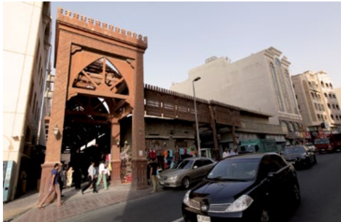
▲ Wejście do Textile Souk

na którym kupcy z Pakistanu handlują barwnymi tkaninami i pamiątkami. Można tu nabyć wyroby z Pakistanu, Kaszmiru i Radżastanu. Dostępne są indyjskie stroje, dżutti – tradycyjne buty z zardartymi noskami wykonane ze skóry i bogato zdobione, szale paszminowe (rodzaj wełny kaszmirowej), poduszki, narzuty.