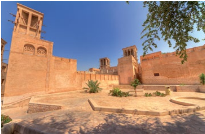
▲ Historyczna część Dubaju

W reprezentacyjnym budynku na rogu historycznego kompleksu Bastakiya swoją działalność prowadzi centrum kulturalne ★ Sheikh Mohammed Centre for Cultural Understanding 📍 Al Musallah Rd 26, najbliższa stacja metra: Al Fahidi; www.culturalunderstanding.ae ; rezerwacji należy dokonać wcześniej pod nr. tel.: +971 4 353 6666. Organizowane są tu spotkania kulturalne przy posiłku w tradycyjnym arabskim stylu. Goście są zapraszani do otwartej dyskusji i zadawania pytań lokalnym wolontariuszom na tematy kulturalne, obyczajowe i religijne. Każdy zainteresowany może wziąć w nich udział. Do wyboru są kulturalne śniadania , które odbywają się w poniedziałki i środy o 10.00, koszt 60 AED. Na lunche centrum zaprasza we wtorki i niedziele o 13.00, koszt 70 AED, natomiast kulturalne obiady mają miejsce we wtorki o 19.00, koszt 95 AED. Centrum organizuje również wycieczki po obiekcie i najbliższej okolicy. Za 55 AED możemy wziąć udział w wycieczce po uliczkach Bastakiya, w programie zwiedzania znajduje się również meczet. Po powrocie na podróżników czekają daktyle, kawa i herbata po arabsku. Wycieczka pieszka po starej