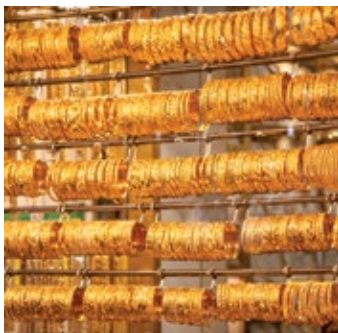
▲ Biżuteria na rynku Gold Souk

przed zakupami, gdyż ceny wyjściowe wyrobów są zwykle znacznie zawyżone. Negocjacje są mile widziane przez wszystkich sprzedawców.