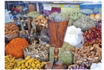
▲ Spice Souk

Aby móc powiedzieć, że widziało się Dubaj, nie można pominąć tego miejsca! ★ Gold Souk 📍 Al Khor St , to pasaż handlowy opływający w złoto i diamenty. Obok