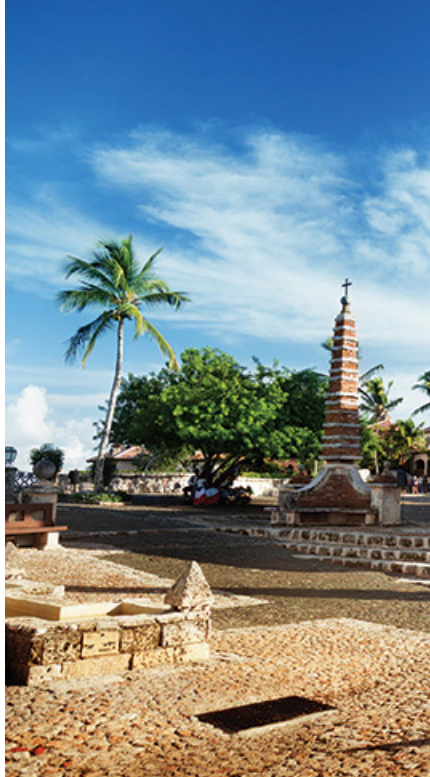
▲ Altos de Chavón

Gwarne i wiecznie zatłoczone Santo Domingo potrafi szybko zmęczyć nawet największych amatorów współczesnych betonowych dżungli. Aby uciec od tłumów, smogu i hałasu, wystarczy obrać kierunek na zachód od stolicy. Zaledwie kilkadziesiąt minut jazdy autobusem może przenieść do całkiem innego świata, a czasem nawet do innej epoki.