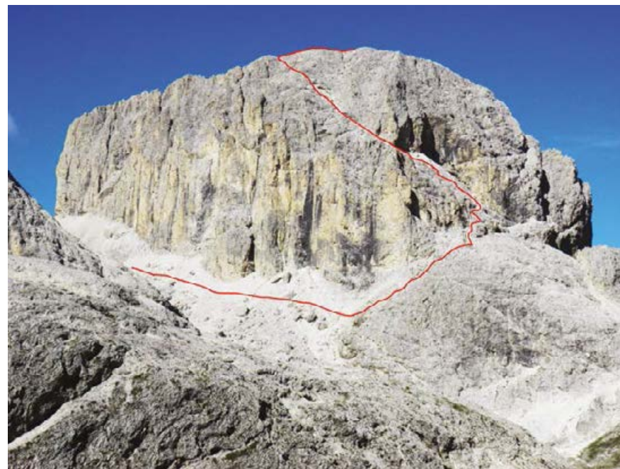
✦ DROGA WEJŚCIOWA FLANKĄ WSCHODNIĄ.

od schroniska Rif. Passo Principe, lub flanką północno-wschodnią od schroniska Rif. Antermoia. Obie żelazne perci nie są zbyt trudne, strona wschodnia ma bardziej strome odcinki. Jeśli na miejsce startu wybierzemy schronisko Rif. Gardeccia (dojazd jedynie autobusem wahadłowym), wejście stroną południowo-zachodnią jest korzystniejsze. Zejście odbywa się wówczas stroną północno-wschodnią, tak że wykonuje się pełen trawers szczytu.