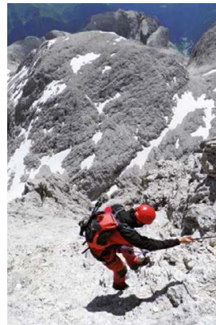
▲ ZEJŚCIE FERRATĄ NA FLANCIE WSCHODNIEJ.

Pniemy się skalnym grzbietem i wykonujemy trawers w prawo (drogowskazy i kamienne kopczyki) do szerokiej, nieubezpieczonej piarżystej półki, która prowadzi w lewo pod ścianę skalną. Może tu zalegać do lipca stromy śnieg, który można obejść zboczem z blokami skalnymi i rumoszem poniżej półki (zachowajmy wzmożoną ostrożność). Przeszedłszy półkę, pniemy się po ubezpieczonych stalową liną blokach skalnych do kolejnej piarżystej półki, po czym znów po ubezpieczonych blokach skalnych do szczery przy ambonie ze skalnym murem z lewej strony. Tuż przed szczerbą podążamy za liną w prawo