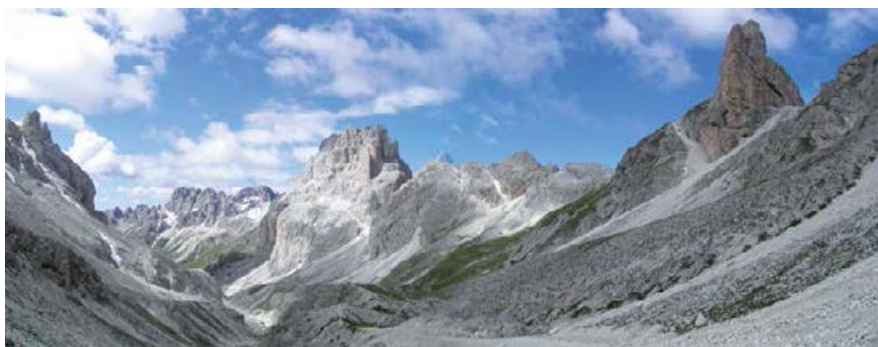
♣ WIDOK NA DOLINĘ VAL DE VAJOLET.

★ Okoliczne cele: Rif. Vajolet, Rif. Preuss, Rif. Passo Principe.