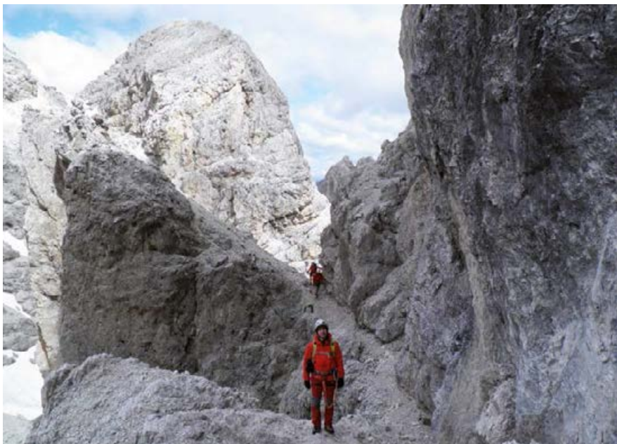
▲ PÓŁKA SKALNA NA ZACHODNIEJ FERRACIE.

Droga podąża początkowo nieubezpieczoną, ale szeroką półką skalną w lewo, z krótkim, wąskim odcinkiem poniżej niedużego spiętrzenia. Przy kancie prowadzi w prawo do żlebu, w którym zalega długo śnieg. Następnie droga kieruje się pierwszym, nieubezpieczonym, ale wyposażonym w żelazne pręty kamienisto-piarżystym zboczem do niewielkiej przełęczy. Teraz podążamy dobrze widoczną, z początku nieubezpieczoną skośną półką, która przecina południowo-zachodnią ścianę góry, do piarżystego tarasu, gdzie zaczyna się stalowa lina.