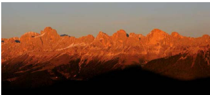
♣ ZJAWISKO „ENROSADIRA” W MASYWIE CATINACCIO, OBSERWOWANE Z PRZEŁĘCZY PASSO DI OCLINI.