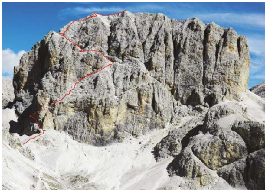
✦ DROGA WEJŚCIOWA NA FLANCIE POŁUDNIOWO-ZACHODNIEJ.

Droga wejściowa wiedzie dwoma ferratami, wzdłuż flanki południowo-zachodniej