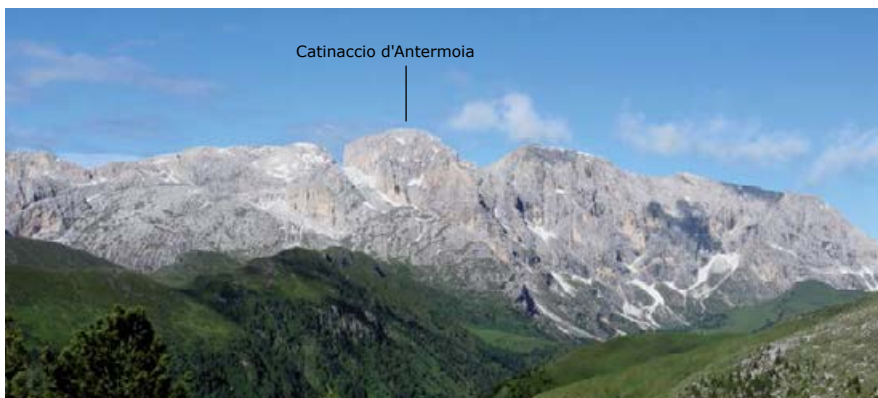
♣ MASYW CATINACCIO.