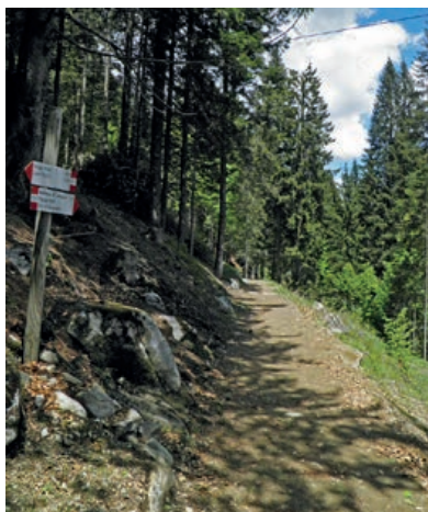
▲ Odbicie szlaku w kierunku Ritorto.

Z centrum Madonny di Campiglio (Conca Verde) docieramy do stacji kolejki gondolowej Spinale i pobliskiego centrum konferencyjnego Pala Campiglio, podchodząc drogą asfaltową, którą idziemy dalej aż do rozwidlenia ze znakami. Na rozwidleniu, kierując się oznaczeniami pętli Giro di Campiglio, idziemy w lewo niewielką asfaltową drogą. Na kolejnym rozwidleniu ze znakami idziemy w lewo ścieżką, która biegnie w lesie mieszanym płaskim terenem. Na następnych dwóch rozwidleniach idziemy w prawo, po czym schodzimy aż do drogi asfaltowej prowadzącej do doliny Vallesinella. Tuż przed kasą biletową skręcamy w lewo. Idziemy do skrzyżowania ze Szlakiem Arcyksięcia (Sentiero dell'Arciduca), gdzie pomijamy drogę asfaltową, która biegnie dalej prosto do doliny i za szlabanem skręcamy od razu w prawo. Przechodzimy