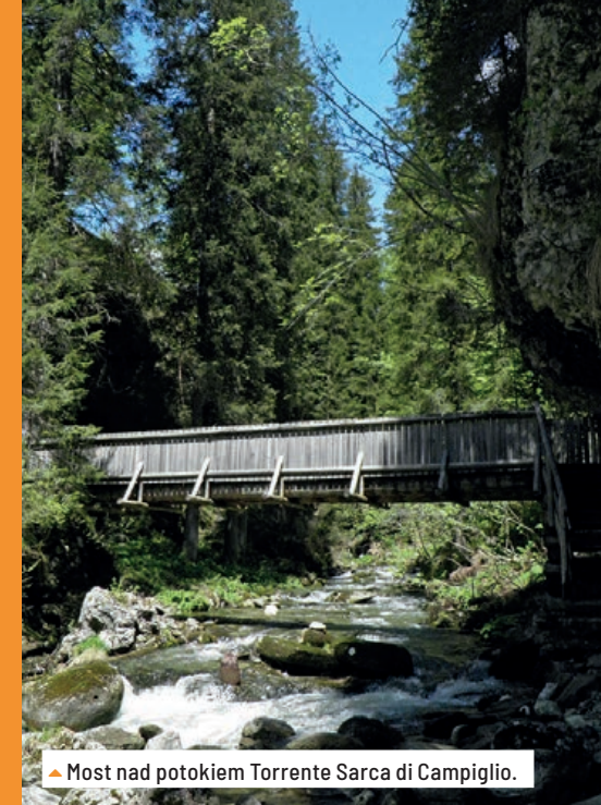
▲ Most nad potokiem Torrente Sarca di Campiglio.