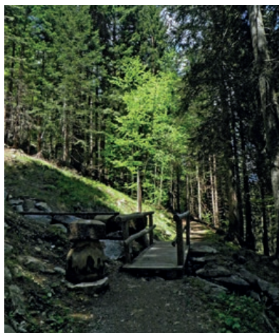
▲ Mostek z rzeźbą w kształcie grzyba.

przez łąkę z ławkami i wchodzimy na ścieżkę oznakowaną na biało i zielono, która schodzi w lewo przez las. Przechodzimy w sumie pięcioma drewnianymi kładkami nad strumykami. Na skrzyżowaniu ze szlakiem 323 prowadzącym do schroniska Rifugio Cascade di Mezzo skręcamy w prawo i schodzimy aż do rzeki Torrente Sarca di Campiglio (1415 m, 1 h), przechodząc po drodze kolejną drewnianą kładką. Przekraczamy rzekę solidnym drewnianym mostem przerzuconym w centrum wąwozu. Podchodzimy przeciwległym brzegiem rzeki pod skalnym okapem (rejon skałkowy). Ścieżka kilkakrotnie kluczy pod przewieszeniem (schodki), które sprawia wrażenie, jakby miało lada moment runąć. Docieramy nią do wyżej położonego lasu. Dalej wędrujemy ścieżką, która prowadzi przez mostek i wychodzi na drogę asfaltową w Colarin (1445 m, 0:20 h, tablica). Przechodzimy przez drogę, kierując się w stronę znajdującej się przed nami tablicy z oznaczeniem pętli Giro di Campiglio (jednej z wielu, które wskazują przebieg trasy). Podchodzimy