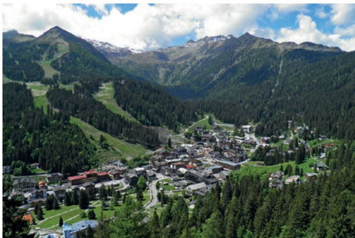
▲ Kurort Madonny di Campiglio widziany z punktu widokowego Piazza Imperatrice.