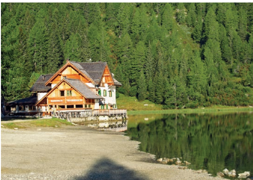
▲ Schronisko Rifugio Lago di Nambino w masywie Presanella (fot. Christian Nannetti).