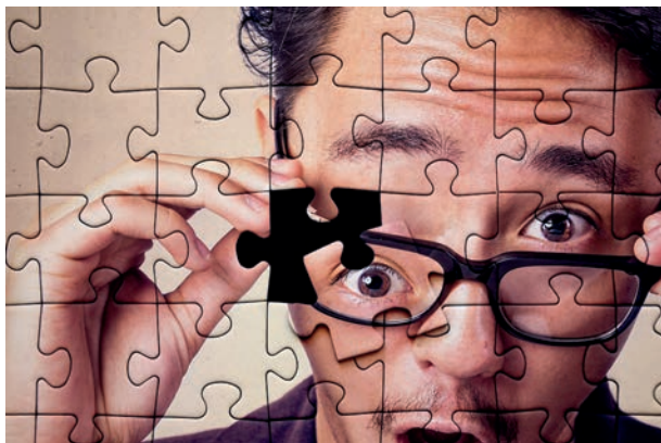
RYСУNEK 23. Układanie puzzli

W przerośni tej uzupełnianie (rysunek 23.) jest po prostu dalszym dokładaniem części do układanki, wyłapywaniem istotnych treści ze środków rozdziałów spośród zalewu słów, które są jedynie stylistycznymi ozdobnikami albo wypełniaczami. A przecież prawdziwa treść publikacji kryje się w twardych danych, które są odpowiedziami na cel pracy. I podobnie jak w puzzlach, miejsca trudne lepiej jest pozostawić na później, kiedy lepiej ukształtuje się otoczenie i gdy ich wypełnienie będzie znacznie łatwiejsze.