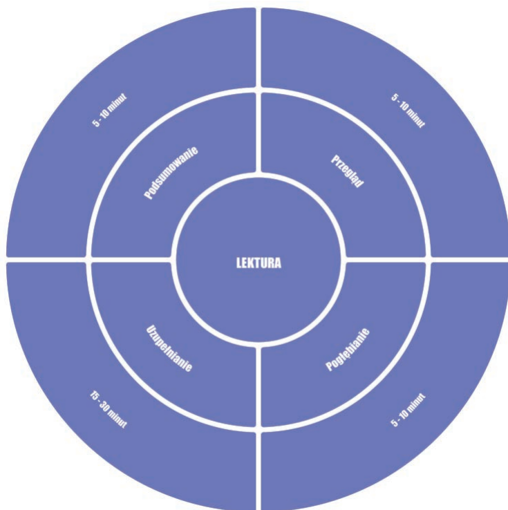
RYSUNEK 25. Lektura

Da ci to nowe doświadczenia, dzięki którym będziesz mógł rozwinąć indywidualne, własne, lepsze przyzwyczajenia w pracy umysłowej. Jak już wiesz, wiele rzeczy opiera się na chęciach.